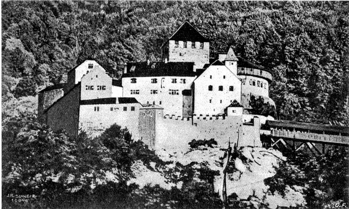
Burg Vaduz in Liechtenstein Abb. 1. Westseite.

was vom erfrischenden Hauch einer neuzeitlichen Romantik erstehen läßt. Möchte dem Spender dieser dichterischen Leitzgaben eine ungestörte und glückliche Wei-