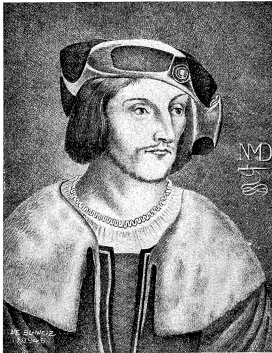
Niklaus Manuel (1484–1530). Lithographie (von c. 1825) nach dem Selbstbildnis (von c. 1530) im Berner Kunstmuseum.