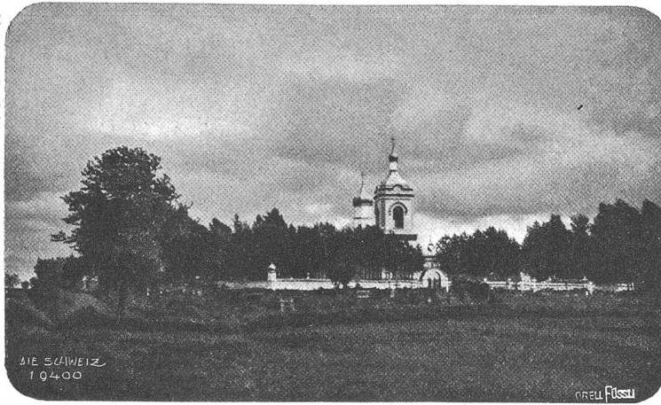
Familiengruft der Grafen Tolstoi zu Dworiki.

jeden Tag fünf Kopeten zurücklegen kannst, und bist du einmal dreißig Jahre alt, dann bist du reich genug.“