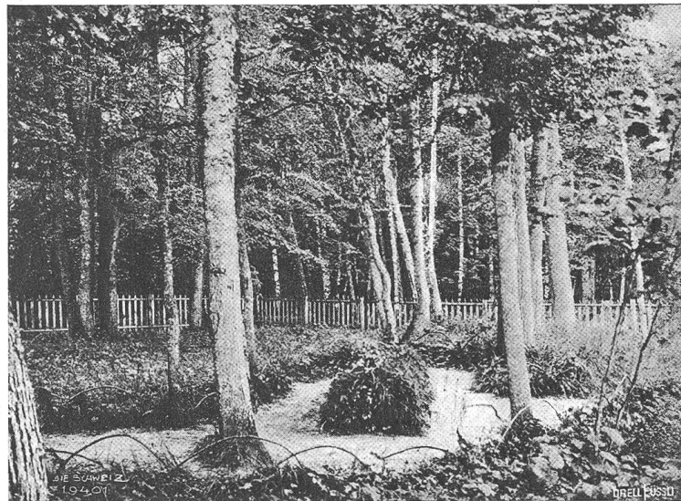
Tolstois Grab im Bannforst von Jasnaja Poljana.

Der Bauer nahm es beim Zügel, führte es bis an den Rand des Wassers und schlug es mit der Peitsche. Das Pferd stürzte vorwärts und ging ins Wasser.