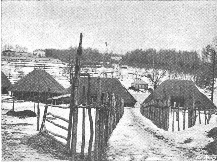
Herrenhaus und Wirtschaftsgebäude in Jahnaja Poljana.

Lew Nikolajewitsch lächelte und sagte: „Wer die Arbeit gehabt hat, der soll auch den Ertrag haben.“