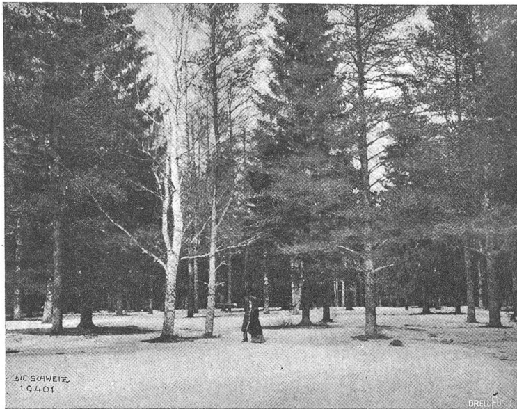
In der „Limonowka“ (von Tolstoi gepflanztes Wäldchen).

Lew Nikolajewitsch hatte für uns immer Zeit und für uns zu allem Lust. Es wurde gelernt, gespielt, gescherzt, Gespräche wurden geführt, Mitternacht wurde herangewacht, im Bannforst und in den Wäldern wurde herumgestreift.