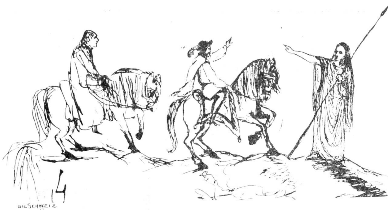
Aus J. V. Widmann's Skizzenbüchern.

Herz unter italienischen Gassenbuben und Lazzaroni auf! Wie traf er den Ton mit den einfachsten Bewohnern unserer Alpentäler! Mit welcher ehrfurchtsvollem Staunen betrachtet er die naiven ländlichen Schönen, die am Sonntag auf dem Marktplatz von Bologna vorüberziehen! Sie geben ihm in ihrer unverdorbenen, warmen Sinnlichkeit eine Ahnung von der Seligkeit Gottes, durch dessen Wesen Millionen solcher Lebensströme ein- und ausfluten. Und ist es nicht bezeichnend für Widmann, daß die einzige Träne, die er in seinen Gedichten und wohl überhaupt in seinen Werken eingesteht, seiner armen, in der Zimmerluft dahinstorbenden Palme gilt?