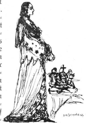
Von J. W. Widmanns Skizzenbüchern.

Da mag er denn manchmal auf Kosten Unschuldiger sein Mütlein geküßt und Feigenblätter mehr als gerade nötig heruntergerissen haben. Allein als schweizerischer Wieland — man durfte den Erotiker auch in Hinsicht auf sein unantastbares Eheleben mit dem Dichter des Oberon vergleichen — als schweizerischer Wieland hat er auch darin eine Aufgabe erfüllt, die zu seiner Zeit kein anderer lösen konnte: er hat unsern Geschmack, der fast nur auf das patriotische und moralische Heldentum, auf lehrhafte und sentimentale Poesie be-