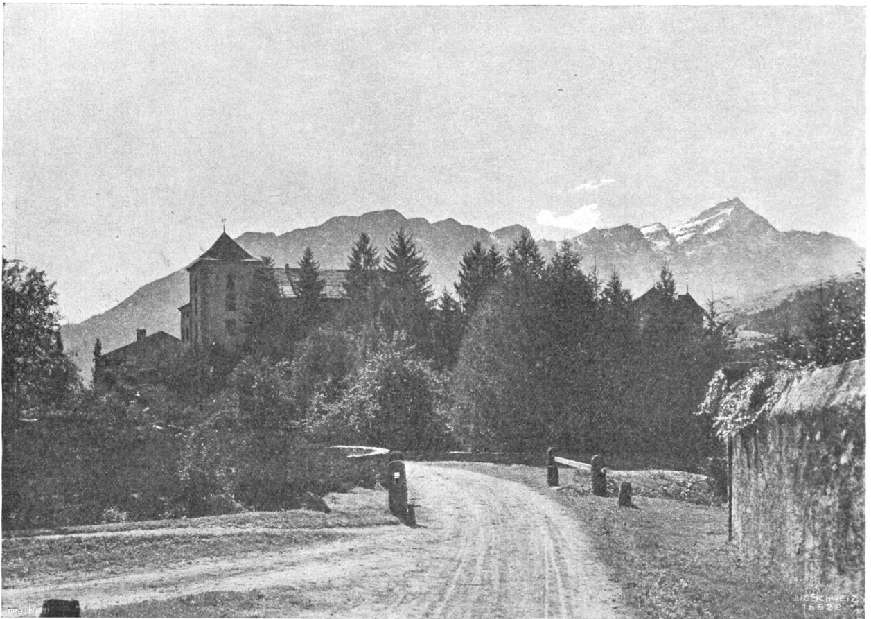
Schloß Fürstenuau (im Domleschg) mit Piz Beverin (3002m).

lebenden erquickenden Alpenluft voll Sonnenschein und Glanz entgegenzuführen und sie für die Arbeit des Alltagslebens und für den oft so harten Erwerbsskampf aufs neue zu stählen.