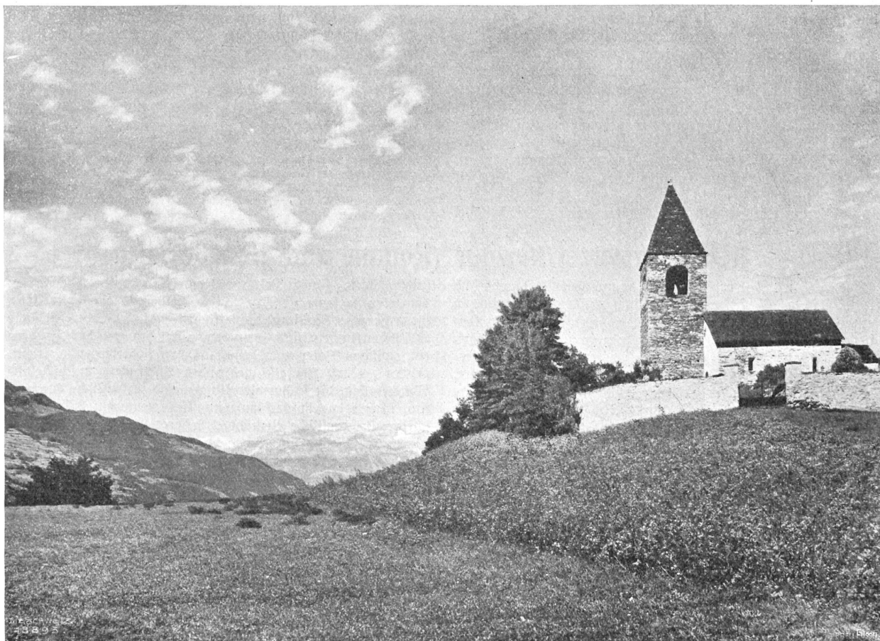
Kapelle St. Cass(i)an (im Domleschg) mit Ringelspiz (3251 m).

Eine ganz andere Sache ist es mit den mittelschwer Erkrankten, bei denen schwere Allgemeinerkrankungen (Lungenentzündung, Typhus, Infektionen, Influenza) oder intensivste Arbeit ohne Ausspannung und langdauernde Gemütsaufregungen das Nervensystem erschütterten. Da ist es mit einer Ruhezeit von zehn bis vierzehn Tagen nicht getan, das ist nur schlechte Flickarbeit. Eine Heilung oder wesentliche Besserung ist da nur von einem mehrmonatlichen Aufenthalte zu erwarten. Auch ergibt der Grad der Erkrankung sofort, daß der Faktor Ruhe ganz in den Vordergrund und der Faktor Sport mehr oder ganz in den Hintergrund tritt. Ja, es besteht zweifellos jetzt schon das dringende Bedürfnis, daß neben Sporthotels, die abends oft bis gen Mitternacht lärmig sind, einfachere Häuser mit der speziellen Bestimmung zur Aufnahme von ruhebedürftigen Kranken auch im Winter an allen Höhenkurorten geöffnet würden. Daß da besonders auch für sorgfältig zubereitete einfache oder wechselnde Kost mit Einschränkung der Fleischzufuhr gesorgt werde, ist immer noch bloß ein Wunsch, der hoffentlich aber bald realisiert wird. Der Pensionsbesitzer an günstigem Höhenorte wird rasch ein volles Haus haben. Ueberhaupt ist die Regulierung der Diät an Kurorten eine offene Frage, deren Lösung schon vor etwa zehn Jahren umsonst von der Balneologischen Gesellschaft Schweiz, Merz in einer Konferenz mit den Herren Hoteliers versucht wurde im Sinne einer Vereinfachung der Menus, einer Herab-