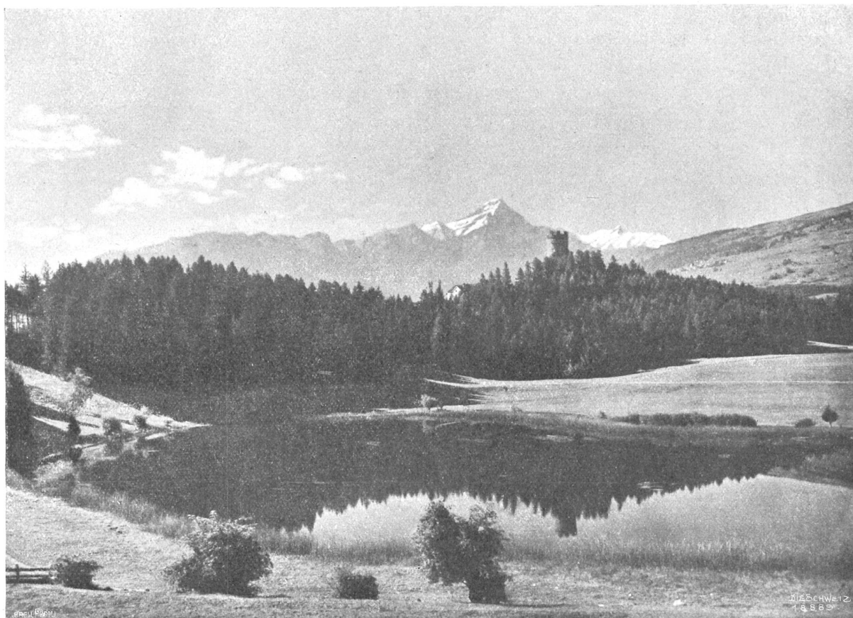
See und Ruine Canova oder Neu-Sins (Casa nova).

schreitet man den Vorderrhein, dann den Rolla. Diesem heute harmlosen Bächlein würde man kaum zutrauen, daß es so gewaltige Verheerungen angerichtet und die Schweizerische Eidgenossenschaft und den Kanton Graubünden wohl über eine Million Franken gekostet hat.