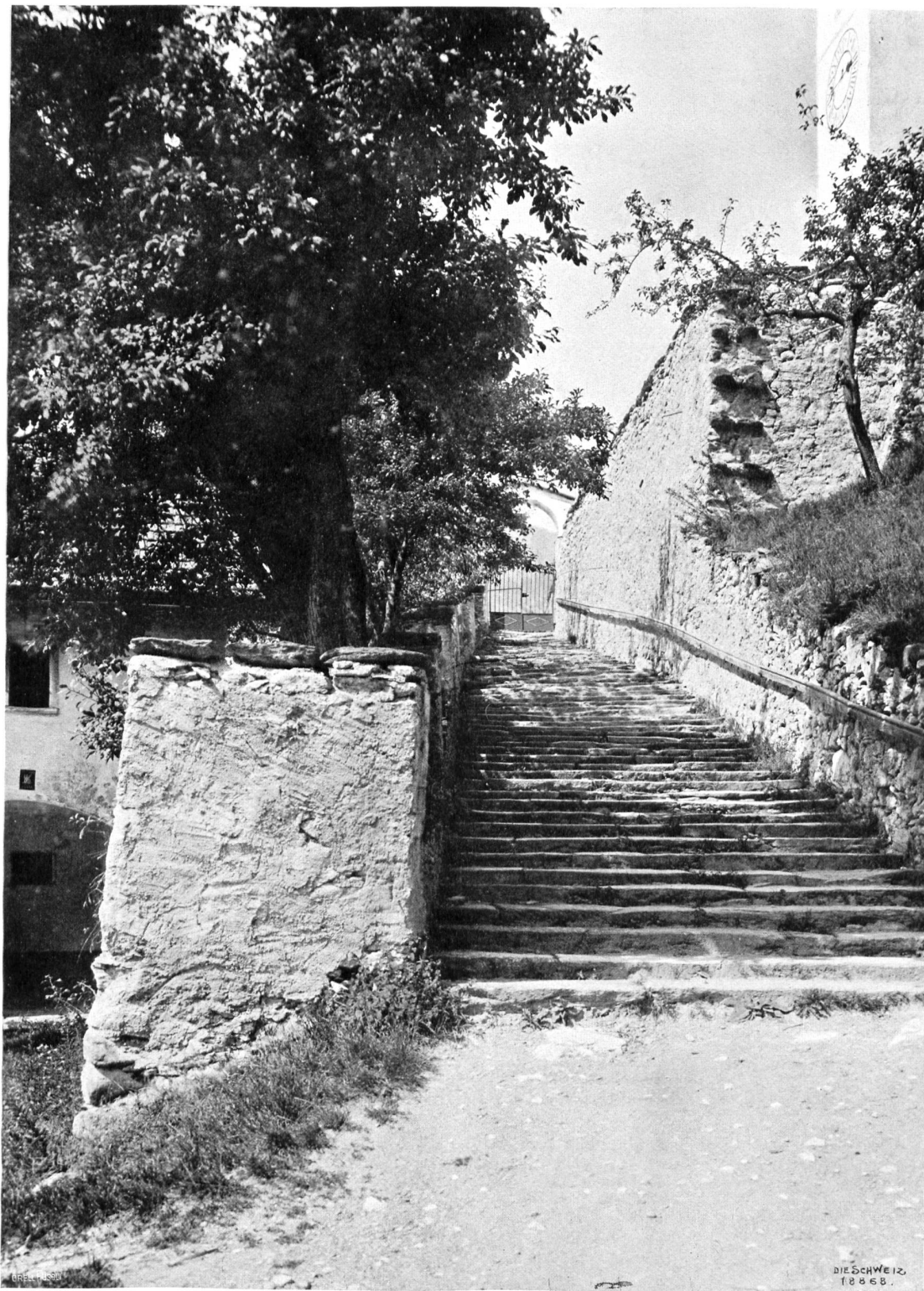
Motiv aus Tomils im Domleschg. Nach photographischer Aufnahme von Domenic Mischol, Schiers.