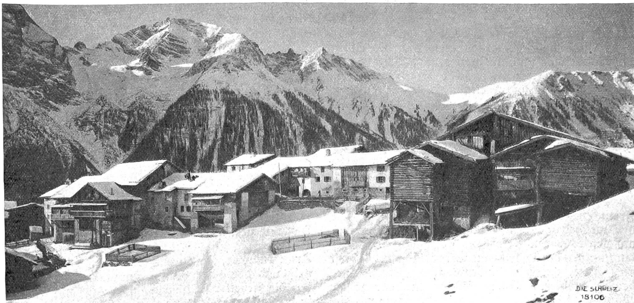
Grächen mit Piz d'Hela (3340 m) und Tinzenhorn (3179 m).