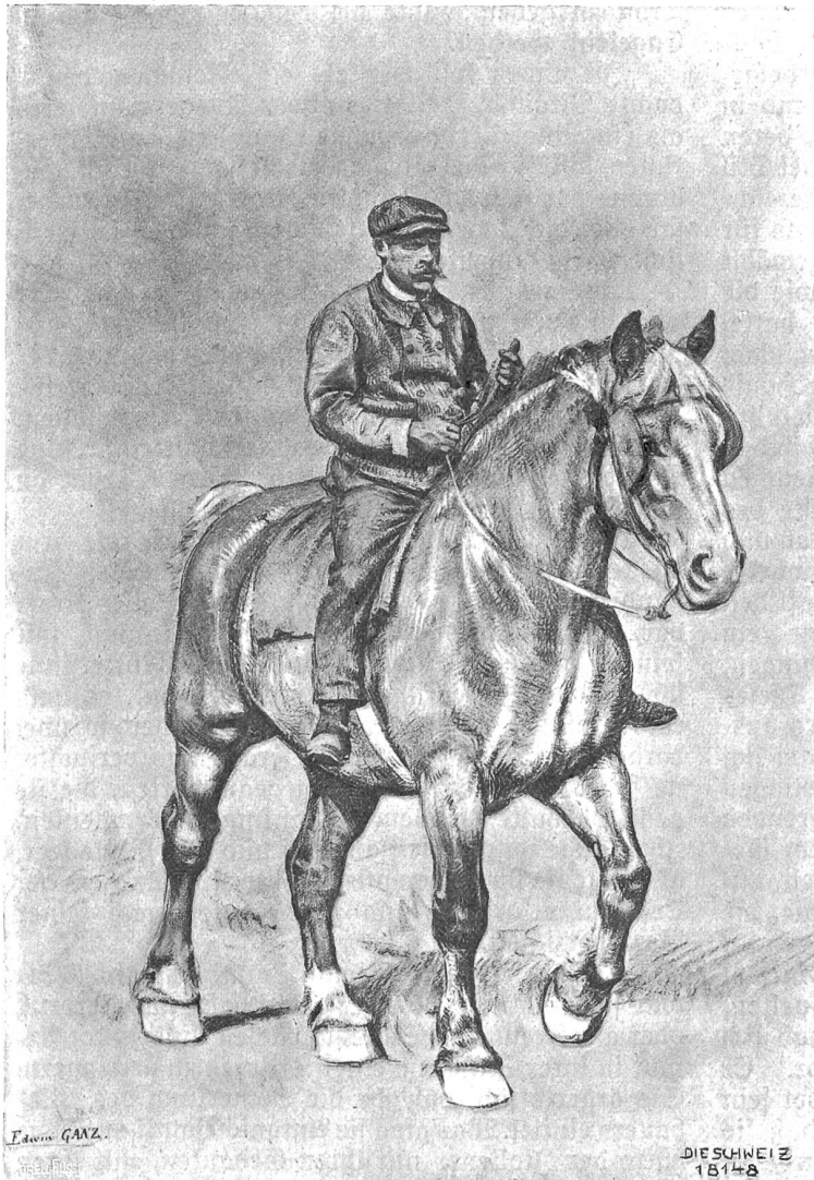
Edwin Ganz, Zürich-Brüffel.