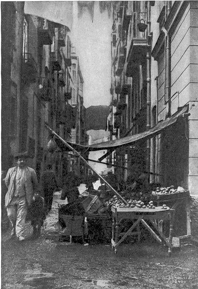
Straßenbild aus Neapel. Fruchthändler.

Von jeher hat der parthenopeische Golf die Völker angezogen mit seinen Wundern. Ueber die Alpen kamen sie herunter und über das Meer. Von allen Seiten. Und wer da war, der blieb, bis ein neuer Eroberer mit ungebrochener Kraft ihn aus dem erschlaffenden Paradiese verjagte oder sich dienstbar machte. Ihre Spuren aber haben alle gelassen: Griechen, Italiker und Germanen, Sarazenen und Ungarn, Franzosen und Spanier. Von jedem dieser Elemente spukt etwas im Charakter des drolligen Volkes, das — von der Natur bald verhätschelt und bald bedroht — sich leichtsinnig gewöhnt hat, den Augenblick zu genießen. Unberechenbar, jedem Affekt nachgebend, jekt finster grollend wie der drohende Vulkan im Hintergrund und gleich darauf lachend gleich der Morgen Sonne über blühenden Mandelbäumen, bildet das Volk ein Gemisch von aufbrausender Leidenschaft und kindlicher Naivität, von widerlicher Geldgier und überquellender Freigebigkeit, von Schlaubeit, Verlogenheit, Unbeständigkeit und ritterlicher, bezaubernder Höflichkeit, von künstlerischen Anlagen, Bedürfnislosigkeit und Luxusfreude, von Aberglauben, bigotter Frömmigkeit und skeptischer Kritik, von brutaler Jähzucht und selbstverleugnender Hilfsbereitschaft. Schnelle Auffassung zeichnet es aus, geistiges Anpassungsvermögen und eine über alles reiche Phantasie, scharf ausgebildeter Spekulationsgeist aber auch und eine seinem starken Individualismus entsprechende Mißachtung des Eigentums. Raum wo an-