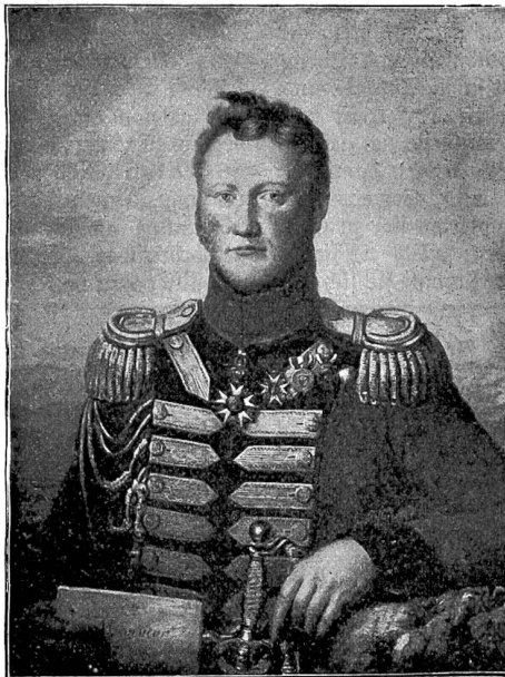
Graf Charles d'Affry als General, Kommandant der Schweizergarde. Nach dem Delbildnis im Besitz des Grafen de Saint-Gilles, Bischof von Freiburg.

das Feuergefecht und wiederholte energische Bajonettangriffe der Schweizerbataillone zum Rückzug bewogen. Als aber Tschitschagow etwas später acht neue Infanterieregimenter ritlings der Straße Stachow-Brill anzusehen und mit diesen den Durchbruch zu erzwingen beschloß, erlitten die gelichteten Schützenlinien der Schweizer größere Verluste als je zuvor; der beschneite Boden war weithin rot gefleckt von den Waffentrümmern, dem Blut der roten Schweizer und der Polen; im ganzen wurden sieben Bajonettangriffe ausgeführt, und siebenmal wurden die Russen blutig abgewiesen. Von den Stabsoffizieren der vier Schweizerregimenter stand nur noch der Major Imthurn wie ein Turm in der Linie. Bei dem Appell, der nach dem Gefecht an Ort und Stelle gemacht wurde, waren nur noch 300 Mann in Reih und Glied; die Schweizer hatten somit einen Gefechtsverlust von ca. 1200 Mann oder 80% der Frontstärke. Bevor General Merle vom Kampfplatz zurücktritt, kam er zu den Schweizern, die nun an wenigen Bivakfeuern vom Kampfe ausruhten; er rief ihnen zu: „Brave Schweizer! Ihr