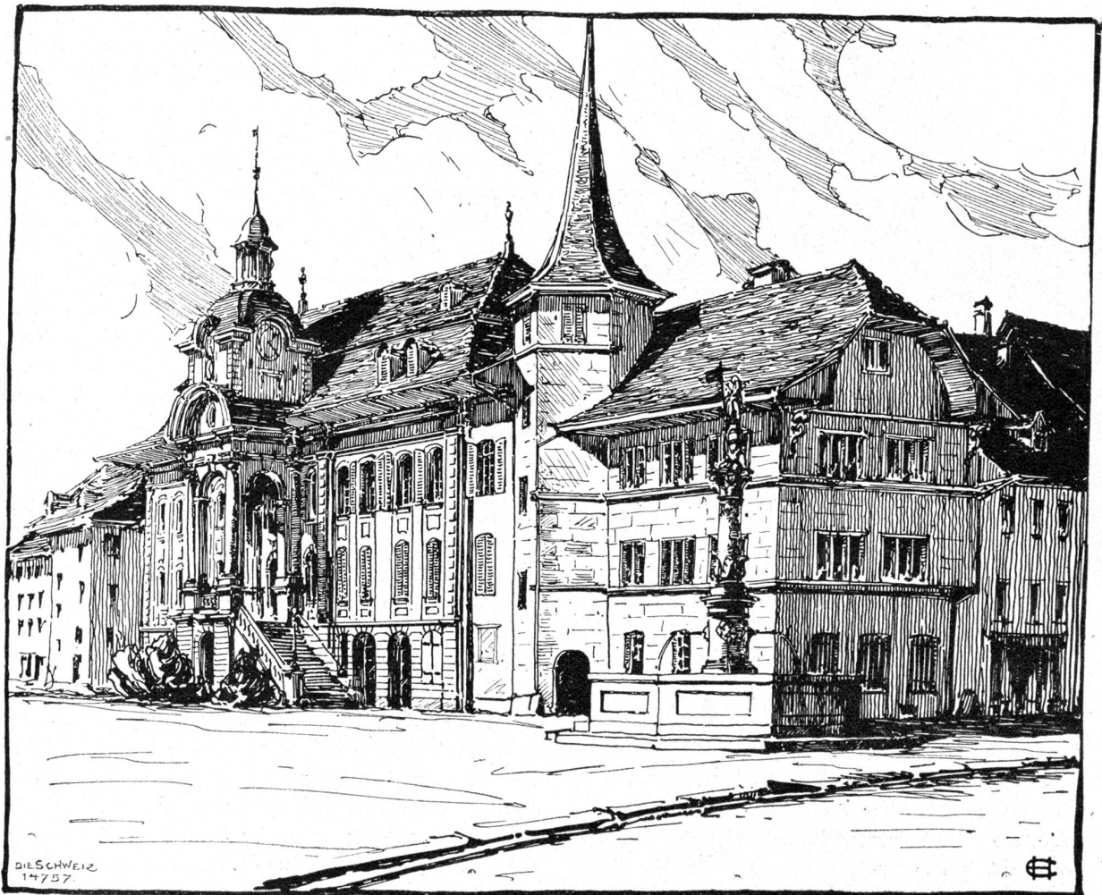
Rathaus in Zofingen (Aargau). Nach Federzeichnung von Erwin Seman, Basel.

das weitgeschnittene Jackett ließ die Linien der Büste nur ahnen. Zurückgelehnt in die Ecke saß Eva und sah durch die spiegelnden Scheiben auf die Straße hinaus.