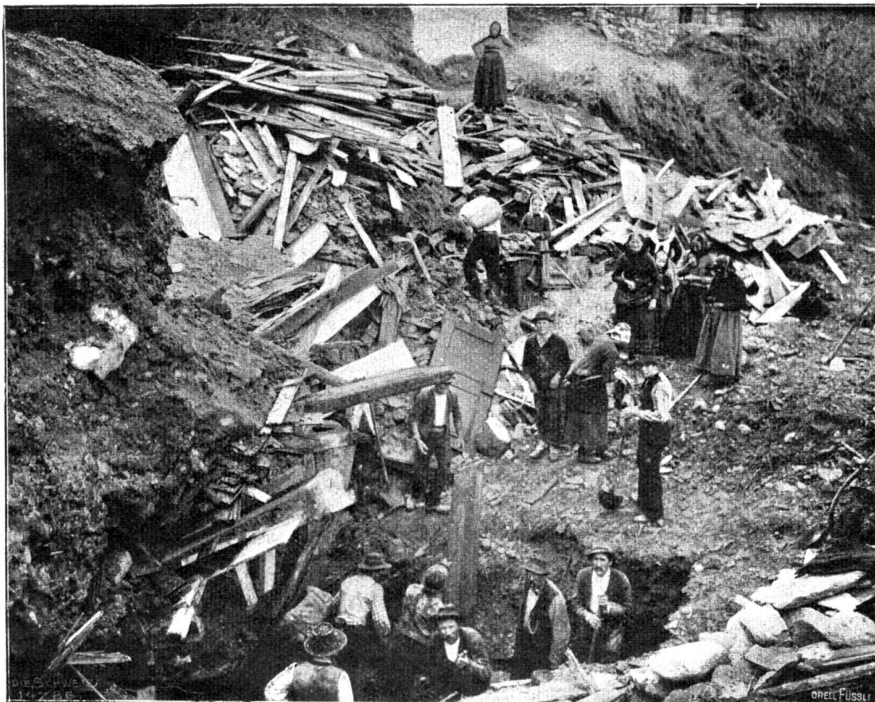
Lawinenunglück in Grengiols. Aufsuchung der Verunglückten.

Erst 1769 wieder betrat er Schweizerboden und zwar in Lugano. Casanova war schon ein müder Mann; England namentlich hatte ihn gebrochen, und er mußte darauf bedacht sein, seine Zukunft mehr im Auge zu haben und sich eine Unterkuft zu sichern. Zu diesem Behufe wollte er sich mit der Republik Venedig ausöhnen. Eine Widerlegung des giftigen Werkes von Amelot de la Houssaye: «Histoire du Gouvernement de Venise» sollte ihm die Handhabe dazu bieten. In sechs Wochen arbeitete er also in Lugano diese Widerlegung aus und ließ sie daselbst bei Agnelli drucken. So hat die Schweiz denn auch an Casanovas literarischen Arbeiten Anteil. Da das Werk sehr selten geworden, trotzdem es in zwölfhundert Exemplaren verkauft worden ist und Casanova tausend