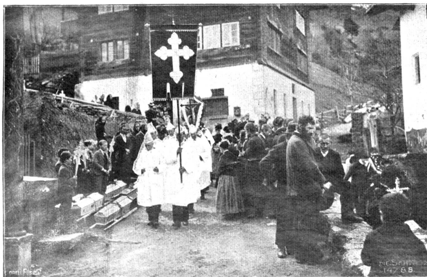
Lawinenunglück in Grengiols. Szene aus dem Leichenzug.

Casanovas kometenartiges Gestirn senkte sich immer tiefer, um in Nacht zu entschwinden; denn auch das Manuskript seiner Memoiren hatte bis jetzt unaufgeklärte Abenteuer und ist nur durch einen Zufall erhalten geblieben. Die Memoiren enden 1774, und bis dahin war Casanova nicht mehr in der Schweiz; ob er auf seinen spätern Reisen diese flüchtig berührt hat, ist uns unbekannt geblieben; die bis jetzt fast unausgebeuteten