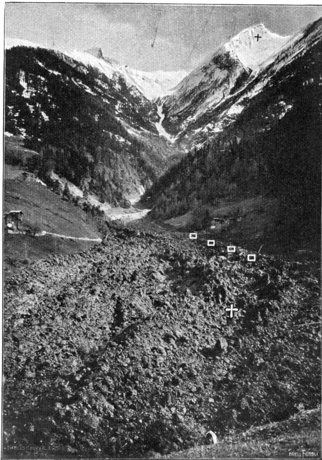
Lawinenunglück in Grenchols. Das Lawinenfeld.

In Genf angekommen, stieg er wieder bei der „Wage“ ab und traf alsbald seine alten Bekannten, den ehrenwerten Syndicus, seinen Maitre de plaisir, der ihm alsbald um den Hals fiel, die Herren Tronchin, den berühmten Arzt und seinen Bruder, den Bankier, die drei Schönen, den Genfer Pfarrer und die