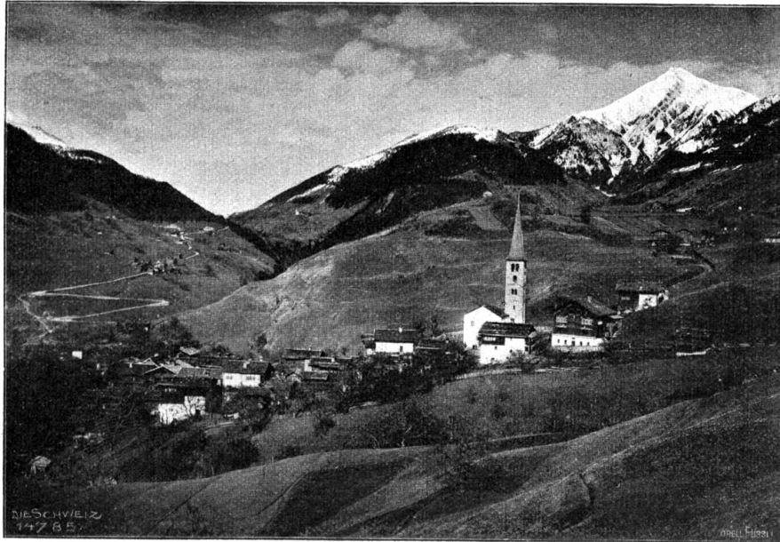
Grengiols im Oberwallis (Bezirk Navon); links die Furkastraße.

sein Vater sich nach seinem Leben in den verflossenen Jahren erkundigte, tauchte plötzlich, wie ödes Felsenland aus dem Nebel, seine schlummernde Existenz als Lastträger des Maurermeisters wieder auf, und Salomes werktätige Liebe, die ihn vom Untergang beschützte, strahlte aus dem Dunkel.