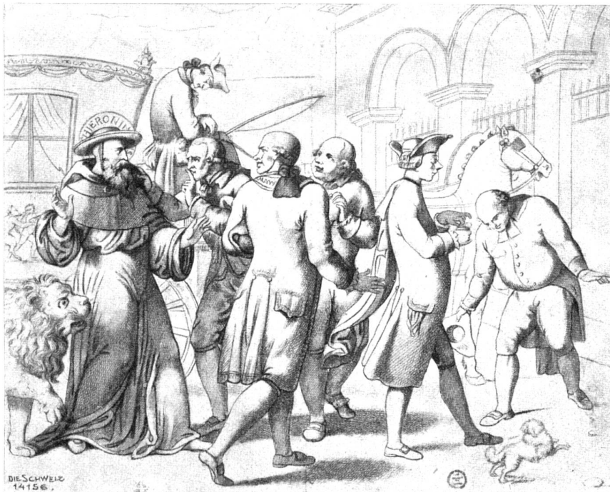
O tempora, o mores! Nach einer Radierung von Hieronymus Hef (1799—1850) in der öffentlichen Kunstsammlung von Basel.

Kardinalat. Drahtisch ist zum Ausdruck gebracht die moralische Entrüstung des Heiligen über den bösen Wandel der Sitten. Die drei Lakaien des Kardinals suchen den alten Hieronymus zu beschwichtigen und zum Schweigen zu bringen, während der Kardinal, vollständig weltlich gekleidet, eine Prise nehmend, seiner Basilika zuschreitet, wo er am Tor vom dicken geistlichen Major-domus mit diesem Bückling empfangen wird.