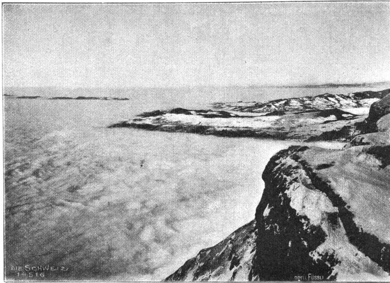
Nebelmeer vom Rigi. Blick nach Nordost auf Albisette, Zugerberg und Zürcher Oberland.

Agathe schickte ein heißes Dankgebet zum Himmel. Der Arzt war nicht bloß ein geschickter, sondern auch ein menschenfreundlicher Mann. Er hatte allerlei in dem kleinen Haushalt beobachtet und wollte nicht, daß den Angstktagen noch ein verkümmertes dürftiges Weihnachtsfest folge. Er selbst brachte am Weihnachtsabend ein Bäumchen und bunte Kerzen und jagte lachend, Agathe solle ihm, der dazu wenig Geschick habe, helfen, „Christkind“ spielen. Er war ein bisschen ein Zerstreuter, der gute Herr Doktor, und kratzte sich beschämt hinter den Ohren, als aus einem Paket eine Trommel zum Vorschein kam. In komischer Verstärkung rief er aus: „Ach, da habe ich im Momente nicht mehr gewußt, ob's ein Bub oder ein Mädel ist! Na, du kleine Regimentstochter, so komm mal her, wir wollen eins trommeln!“