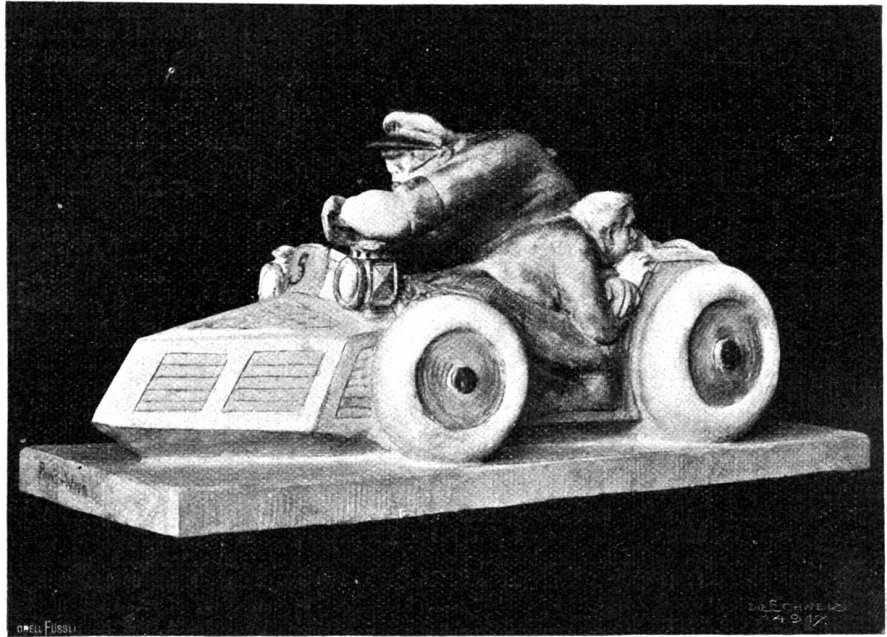
Automobilfahrt Paris-Wien. Nach einer plastischen Gruppe von Franz Wanger, Zürich-München.