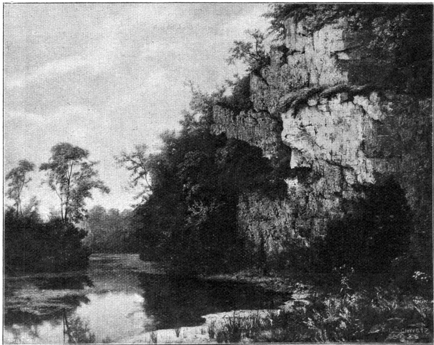
Sumpflandschaft. Nach dem Gemälde von Jacob Lorenz Rüdelsühl (im Basler Museum).

Es mochte kaum sieben Uhr morgens sein, und die graue Dämmerung schlief noch ruhig über den weißen Feldern. Sie lag wie ein dichter, feuchter Schleier um die Wagen, das Zelt und die nächsten Häuser. Sie verbarg ganz den Graben und den Wall um das Städtchen, in dessen schmalen, stillen Straßen die Heveille ertönte. Die traurigen, finster klingenden Töne des Horns verpflanzten sich durch die dunstige Luft über Wall und Graben und die nahe Wiese, und dieser Morgengespang erreichte Gottliebs Gauklerwagen und das große, einsame Zelt draußen auf dem „Schwanendamm“.