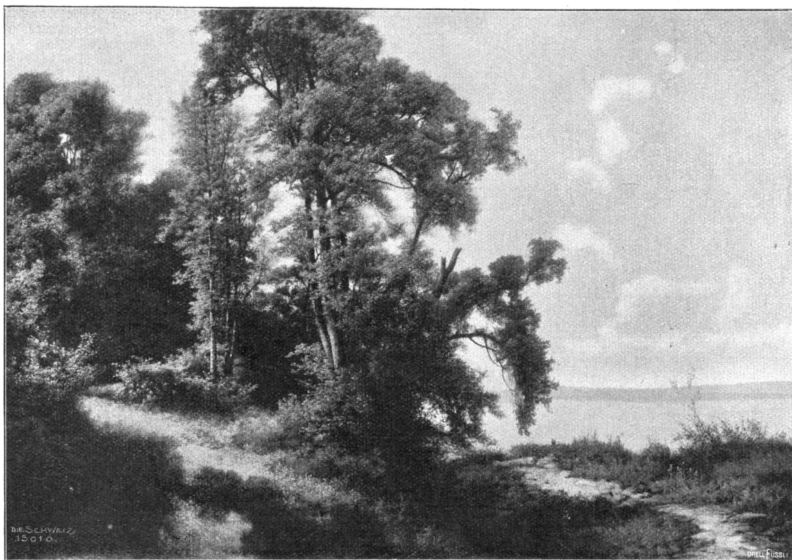
Am Genfersee. Nach dem Gemälde von Jacob Lorenz Mübisühl, Basel.

auf die vereinten Handflächen des Bruders. Ein kurzer, kräftiger Satz, und Alexanders Körper beschrieb einen großen, ruhigen Bogen in der Luft und fiel mit einem weichen Niedersprung auf die Matratze.