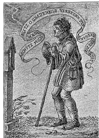
Schütz mich vorm Bliz, o Gnadenbild, Verbrenn den Zinsherrn und die Gilt!