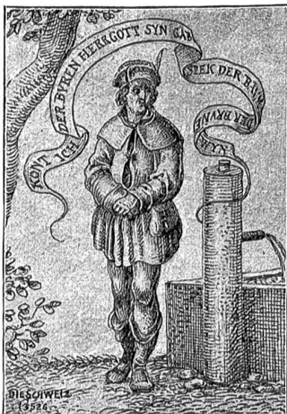
Könt ich der Buren Herrgott syn, Gab Spek der Baum, der Brunnen Wyh.

Bald saßen die beiden Männer in gesondertem Stüblein, und niemand störte sie als der Gilgenwirt, dessen Indiskretion sie nicht zu fürchten hatten. Knechtli erzählte, daß im „Besten Bazen“, wo er so lange aufgehalten worden sei, das junge Mädchen alles aufs beste in Ordnung gebracht und daß überdies Frau Trösch vom „Galmen“, eine zuverlässige Person, dort weile; es werde vermutlich von einem gerichtlichen Einschreiten abstrahiert werden, da es tatsächlich konstatiert sei, daß bei der Unordnung im Kurhaus manche geleistete Dienste nicht durch Baarzahlung, sondern in Naturalien und Effekten vergütet worden seien; wieweit sich das auf schadhafte Gläser und Teller, auch auf ausrangierte Handtücher und dergleichen erstreckte, sei nicht mehr festzustellen. Nepomuk habe manchmal, so übel er auch auf