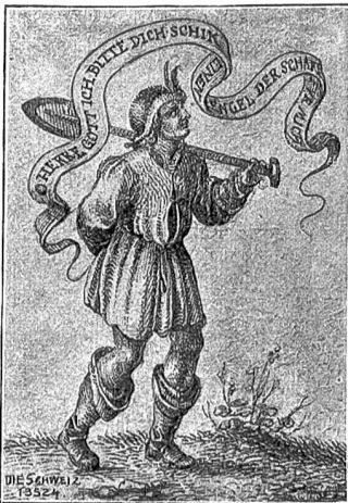
D Herre Gott, ich bitte Dich, Schick einen Engel, der schafft für mich!

Untersuchungen, da eine Ordnung in den Büchern herrsche, daß es einem schwarz werde; der italienische Hechinger geberde sich, als hätte er schon alles in der Tasche.