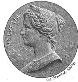
Schweizerdorf-Medaille Paris 1900, von G. Santz.

vates abhängen, der seinen Sitz eines Tages von der Schweiz nach Frankfurt oder Budapest verlegen könne, statt dem Fleiß, der Tüchtigkeit und der gesunden Vernunft des gesamten Volkes des Landes Wohl zu verdanken.