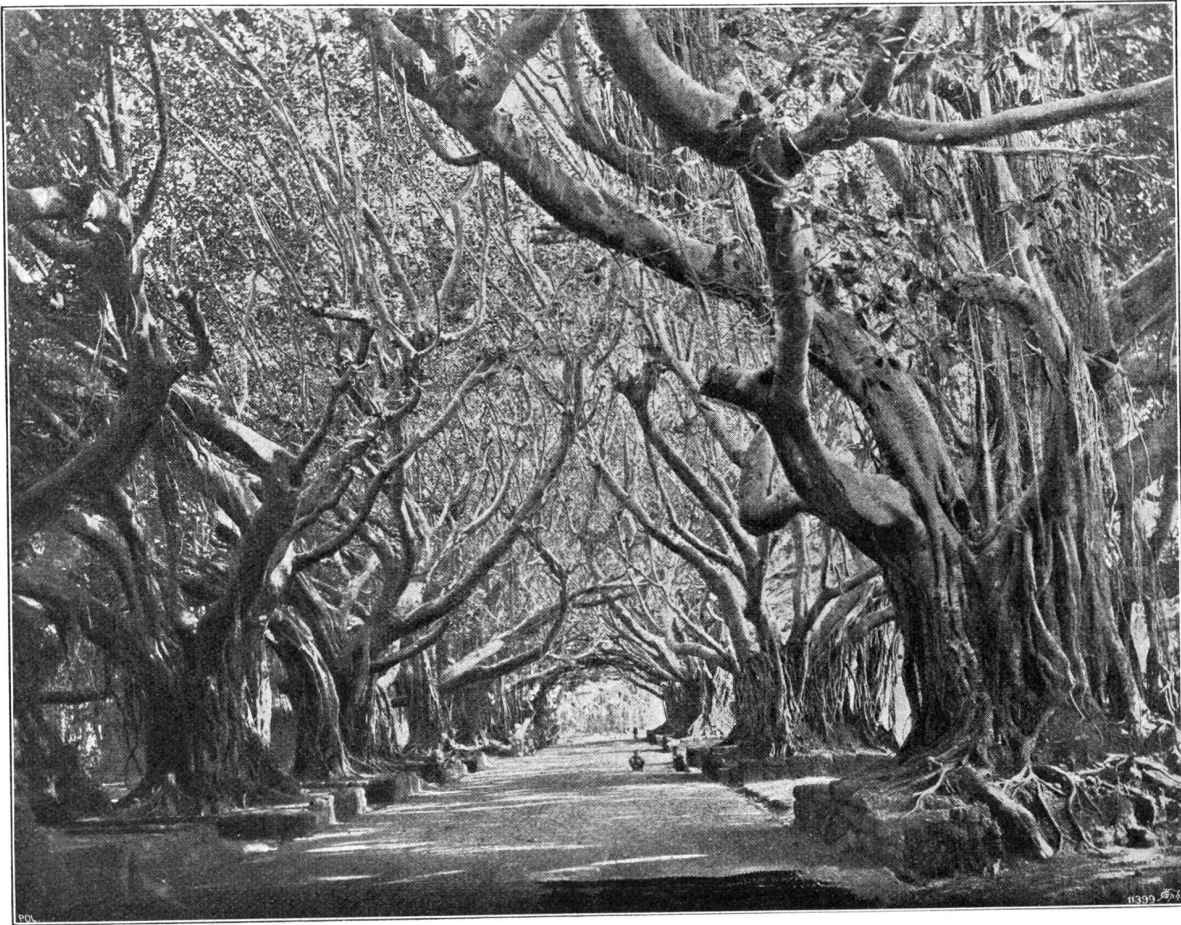
Banyanen-Allee in Honore.

Nachdruck verboten. Alle Rechte vorbehalten.