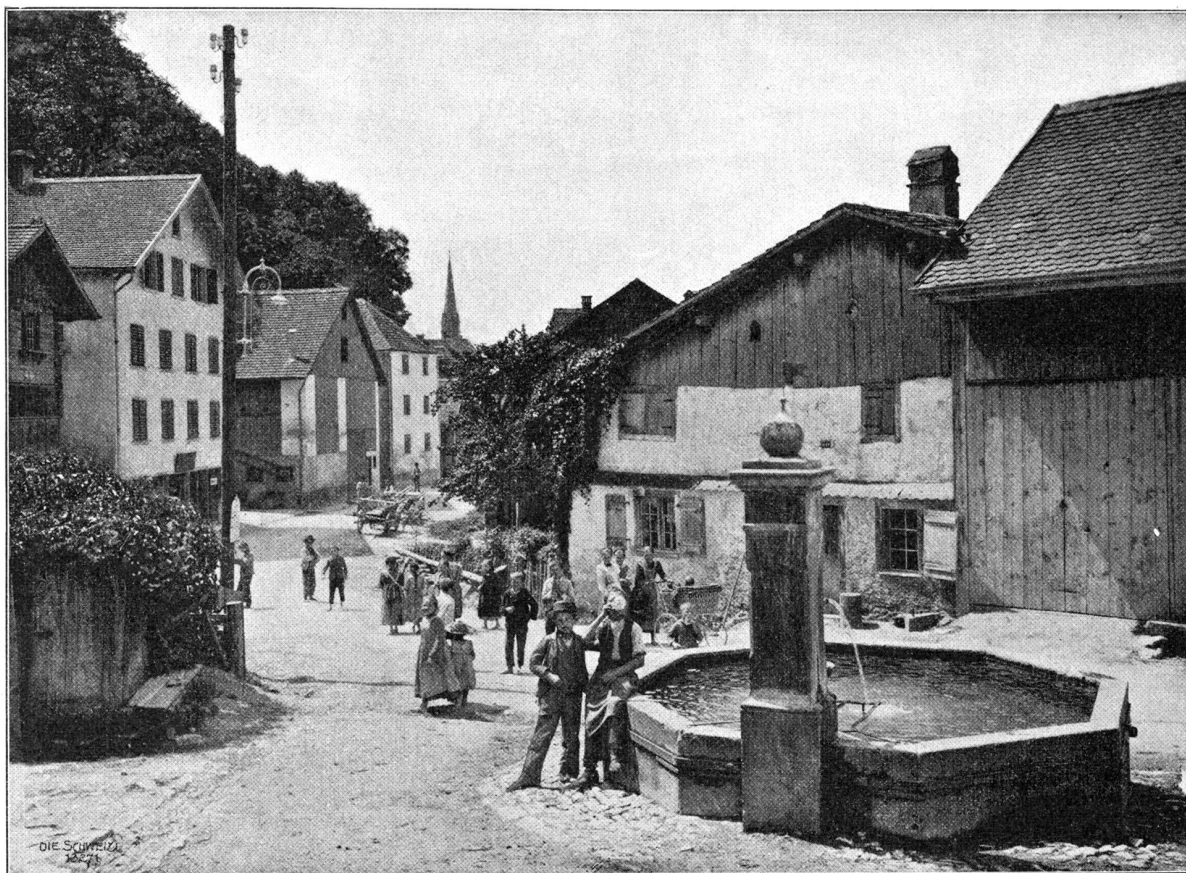
Straßenpartie in Vaduz.