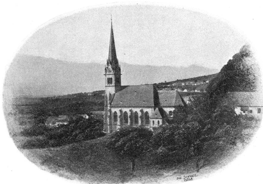
Kirche in Vaduz.

Nach kurzem Frühstückshalt machten wir uns auf den „Fürstensteig“. Der Weg geht zunächst noch etwa hundert Meter durch Bergföhren aufwärts und dann ohne weiteres Präkudium fest hinein in die Felsen. Eine gute Stunde lang klettert nun der schmale, in die Felsen gesprengte Weg an der steilen Wand, die 1400 Meter tief ins Rheinthal abfällt; der Pfad schmiegt sich allen Schluchten, Runsen und Spalten des wildzerklüfteten Gebirges an, durchquert felsige bis in den Sommer hinein mit Schnee gefüllte Couloirs, umgeht dolomitenartige Felsgebilde und zieht sich in kühn erfundener Linie bis zum Grat, dem Gasleijattel hinauf. Hier ändert sich die Szenerie mit einem Schlag. Man tritt durch einen Kamm-einschnitt plötzlich an die Ostwand des Grates, das Rheinthal mit der Rundschau in die Schweiz hinein ist verschwunden und nach rechts hinaus thut sich der Blick in das tiefe dunkle Saminathal hinab und weiterhin eine gewaltige Aussicht in die Tiroler Alpen auf. Etwa eine Stunde lang zieht sich nun der Weg an der Ostwand aufwärts, aber so nahe am Grat, daß man nur ein paar Schritte abseits machen muß, um über ein wildes