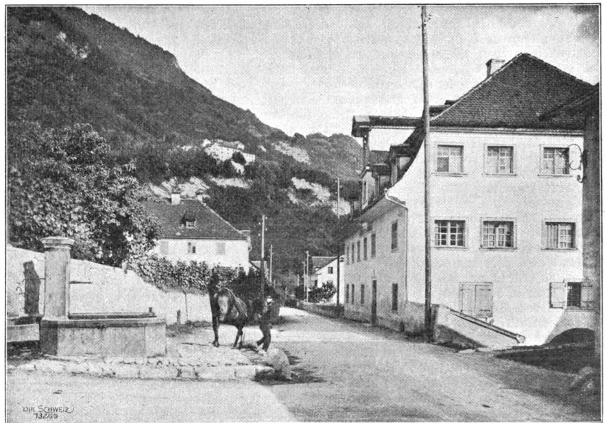
Der „Löwe“ in Vaduz.