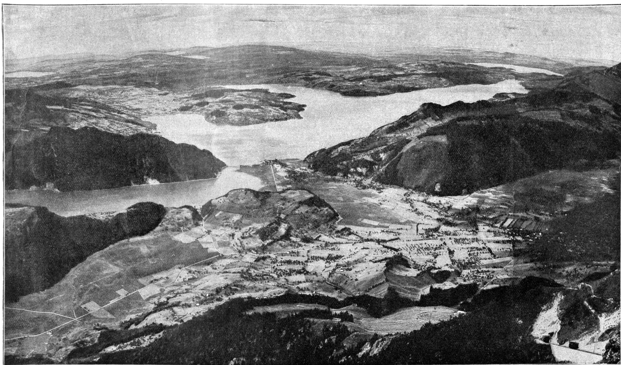
Vierwaldstättersee, Bürgenstock, Luzern und die Nordschweiz vom Stanserhorn aus.