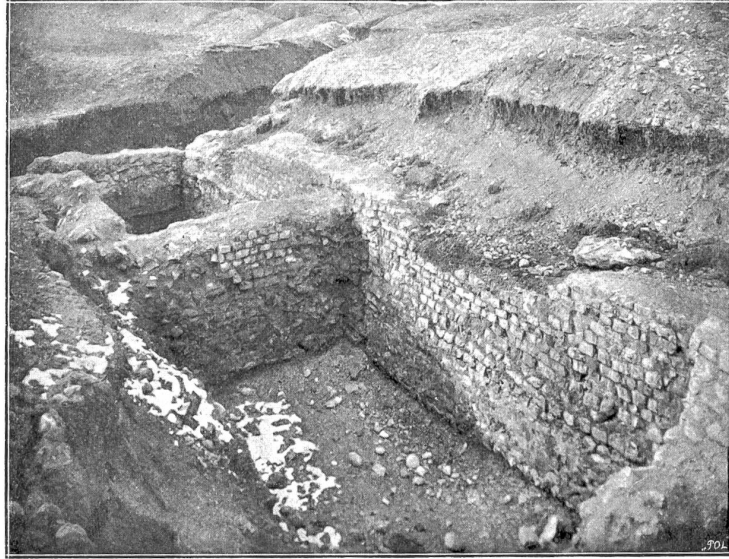
Partie vom Nordosteingang.

Herr Haußer hat eine vorläufige Publikation „Das Amphitheater in Windonissa“ veröffentlicht; ein wissenschaftlicher Bericht über die Ausgrabung steht noch zu erwarten. Die Ruinen sind vom Bunde erworben worden; auch der Kanton Aargau und die Stadt Brugg haben namhafte Beiträge an den Ankauf geleistet. Auf diese Weise ist die Erhaltung der merkwürdigen Reste gesichert, und der Besucher der an Naturschönheiten wie an historischen Denkmälern reichen Gegend wird nicht verfehlen, auch der „Bärlißgrube“ einen Besuch abzustatten.