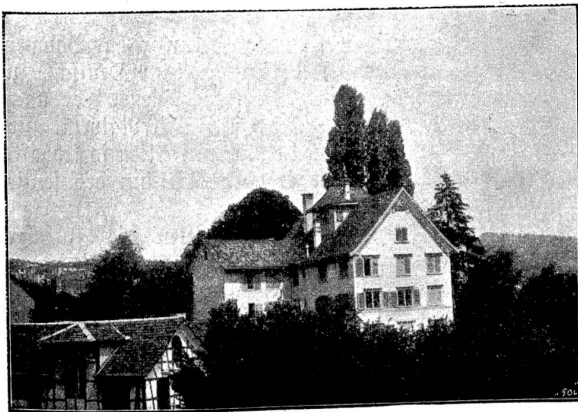
Das Haus „zum Berg“ in Zürich (Bodmers Wohnhaus).

Gerne erinnert sich die Vaterstadt Gottfried Kellers und C. F. Meyers daran, daß sie schon vor anderthalb Jahrhunderten einmal in der deutschen Literatur etwas, und zwar ziemlich viel, zu sagen hatte, wie in der nachklassischen, so einst in der vorklassischen Epoche. Feierten wir doch am 19. Juli, demselben Tag, der uns unsern Meister Gottfried geschenkt, auch den zweihundertsten Geburtstag des Mannes, der die Geistesblüte der Limmatstadt hat wecken helfen.