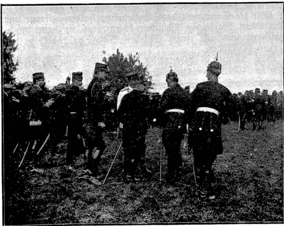
Gruppe von fremden Offizieren. Photograph. Feld in Sorgen.

Das allgemeine Interesse, welches das Schweizer Volk seiner Armee stets entgegenbringt, ist ein erfreuliches Zeichen dafür, daß unser Land, eiferfüchtig auf seine Unabhängigkeit und seine freiheitlichen Staatseinrichtungen, den festen Willen hat, diese, wenn sie je gefährdet werden sollten, aufs äußerste zu verteidigen. Und daß die großen Opfer, welche die Schweiz für die Hebung ihres Wehrwesens bringt, keine vergeblichen sind, dafür leisten jeweilen die größeren Truppenübungen, — die Armeekorps-Manöver — einen thatkräftigen Beweis!