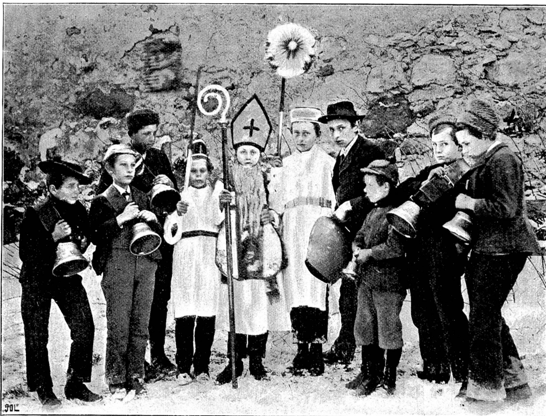
Der „Samichlaus“ in der Urtschweiz.

(6. Dezember) der Samichlausbaum auf dem Familientisch, und die rotwangigen Äpfel, die fastigen Birnen und goldenen Nüsse lachten freundlich auf die beglückten Kinder herab. Der hl. Nikolaus, Bischof von Myra, war von jeher einer der volkstümlichsten Heiligen der kath. Kirche. Stets verehrte man in ihm einen besondern Freund und Vater der Armen, und die Legende erzählt, der Heilige habe drei armen Mädchen, die der Vater in der äussersten Not dem Laster preisgeben wollte, heimlich Geld ins Haus geworfen und so ihre Aussteuer ermöglicht. Gewöhnlich wird daher St. Nikolaus als Bischof abgebildet, der auf einem Buche drei goldene Äpfel trägt. —