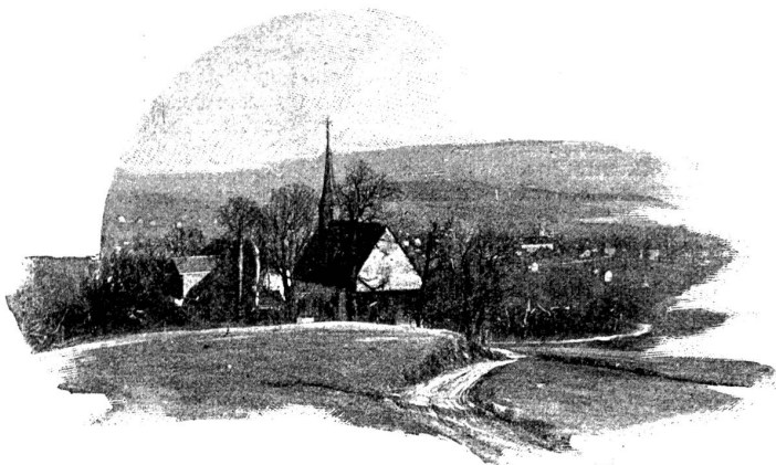
Das Kirchlein zu Allerheiligen (Solothurn): Fundort der Bekkerschen Madonna von Holbein.

Jugend, sondern auch für jeden Wanderer, der da einsam vorbeisritt dem welschen Jura entgegen. Ja, ich erinnere mich noch ganz gut von einer Schülerreise aus meiner Knabenzeit her, an das Entsetzen, welches mir dieser Höllenfürst einflößte, als der uns begleitende Sigrift die Kette rüttelte, so daß die eisernen Ringe klirrend aneinander schlugen. So etwas erregte die jugendliche Phantasie, wie leicht denkbar ist. Hier gehörte es mit zum Geschäfte, wie das Donnerblech zum Theater und der Hexensputz zur Wolfschlucht. Schade darum. Vor Jahren haben Nachtbuben eines nahen Bezirkes aus purem Mutwillen diese originelle Gruppe aus der Kapelle gestohlen und verbrannt. — Fuit. —