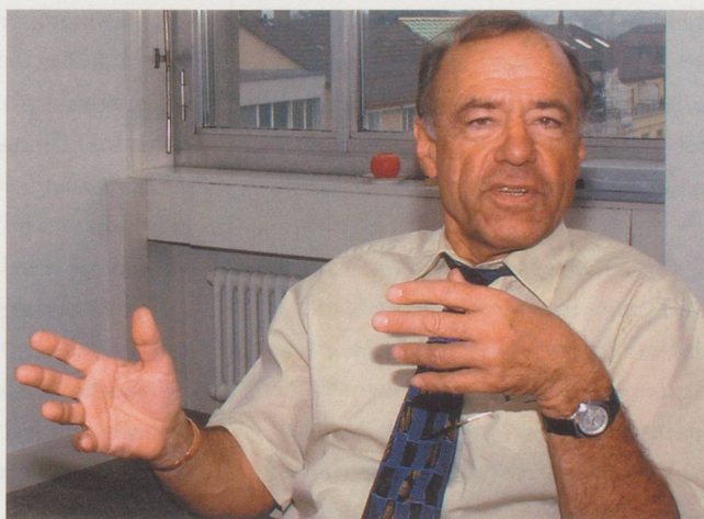
«Das Interesse an einem Ausscheren dürfte für die Kantone klein sein»

sollen Aufschluss über Planung, Qualität, Finanzierung und weitere Elemente geben. Sie sollen die regionale Ausprägung der Kantone berücksichtigen und gleichzeitig der interkantonalen Zusammenarbeit und Koordination dienen. Die Inhalte der Konzepte müssen unbedingt auf eine kantonale Gesetzesgrundlage abgestützt werden. Dies ist auch aus demokratischer Sicht unumgänglich. Die Kantone verfügen wie der Bund über eine vollständige direktdemokratische Ausstattung. Die SODK muss allerdings darauf achten, dass die Konzepte dem Rahmen der IVSE entsprechen und eine Koordination, wo nötig eine Harmonisierung anstreben.