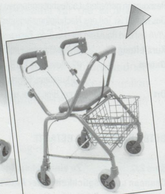
Rollator Modell WK018 Inkl. Sitz, Korb, pannensicherer Bereifung und gepolsterter Rückenlehne. Farbe blau. Preis: Fr. 300.20 inkl. MwSt.

Aktuelle Aktionen immer unter www.gloorrehab.ch !