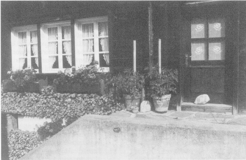
Was wartet hinter geschlossenen Türen und Fenstern?