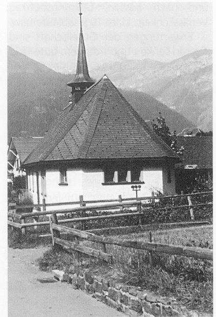
Unter einem Wert verstehen wir eine Idee, einen Leitstern, eine Abmachung oder eine Vereinbarung. Dieser leitet uns und gibt uns Halt. Unser Denken und Handeln orientiert sich an ihm (z. B. die religiösen Werte).

Wir leben in einer arbeitsteiligen Gesellschaft mit Wohlstand und sozialer Sicherheit. Wenn wir dies weiterhin wollen, müssen wir auch leistungsfähig und gemeinschaftsfähig sein. Die Entwicklung der Gemeinschaftsfähigkeit und die gesellschaftliche Eingliederung der Kinder und Jugendlichen bedingen aber Erziehung. Das heisst: Kinder und Jugendliche müssen lernen, Verpflichtungen und soziale Rangordnungen zu berücksichtigen, Frustrationen auf sich