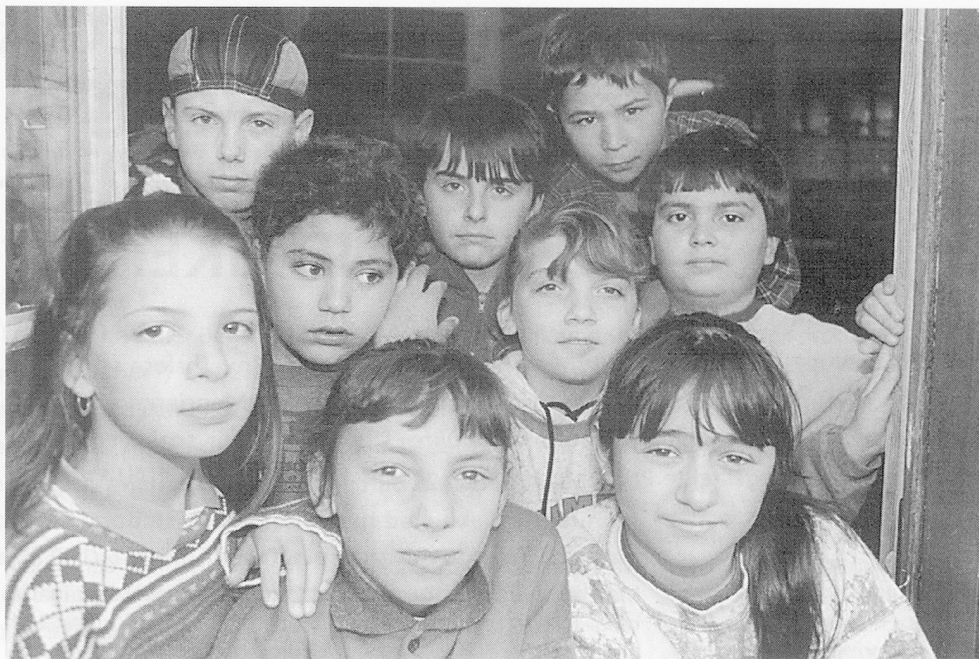
So verschieden die Gesichter sind die Sprachen, die in der Integrationsklasse im Kinderdorf Pestalozzi gesprochen werden.

Familienbegleitende internationale und nationale Hausgemeinschaften: Hier werden Kinder und Jugend-