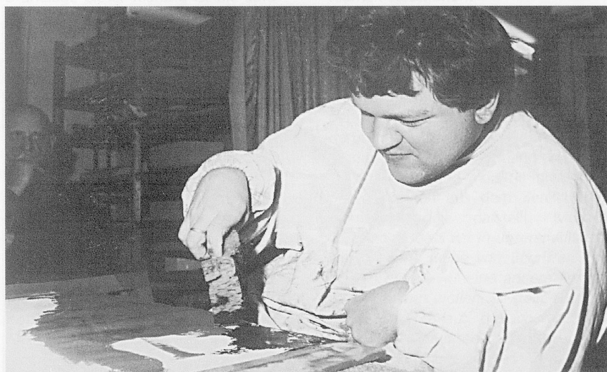
Bilder der Seele