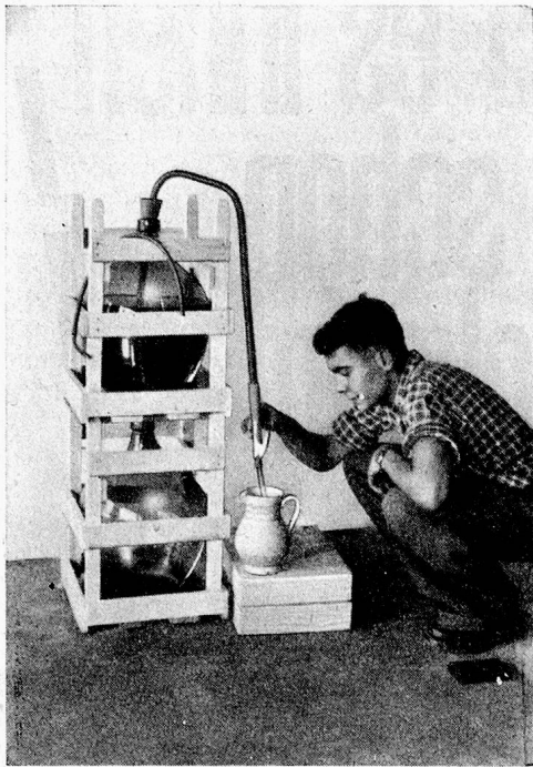
Ausschank mit Siphon (Leistung 12 Liter pro Minute)