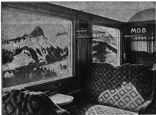
Voiture-salon de la Compagnie Montreux-Oberland Bernois.