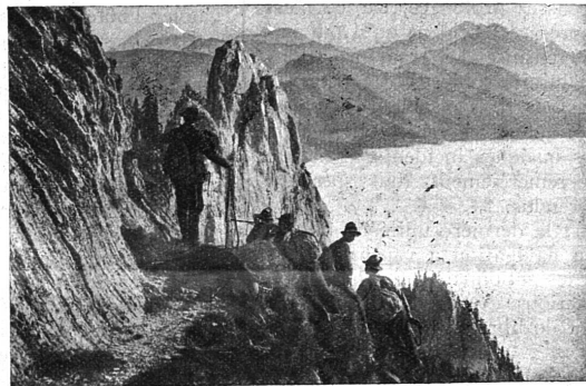
Chasseurs de chamois dans la région du Chemin de fer OBERLAND-BERNOIS.

Par autorisation spéciale, droit d'entrée aux enfants non accompagnés, en matinée seulement.