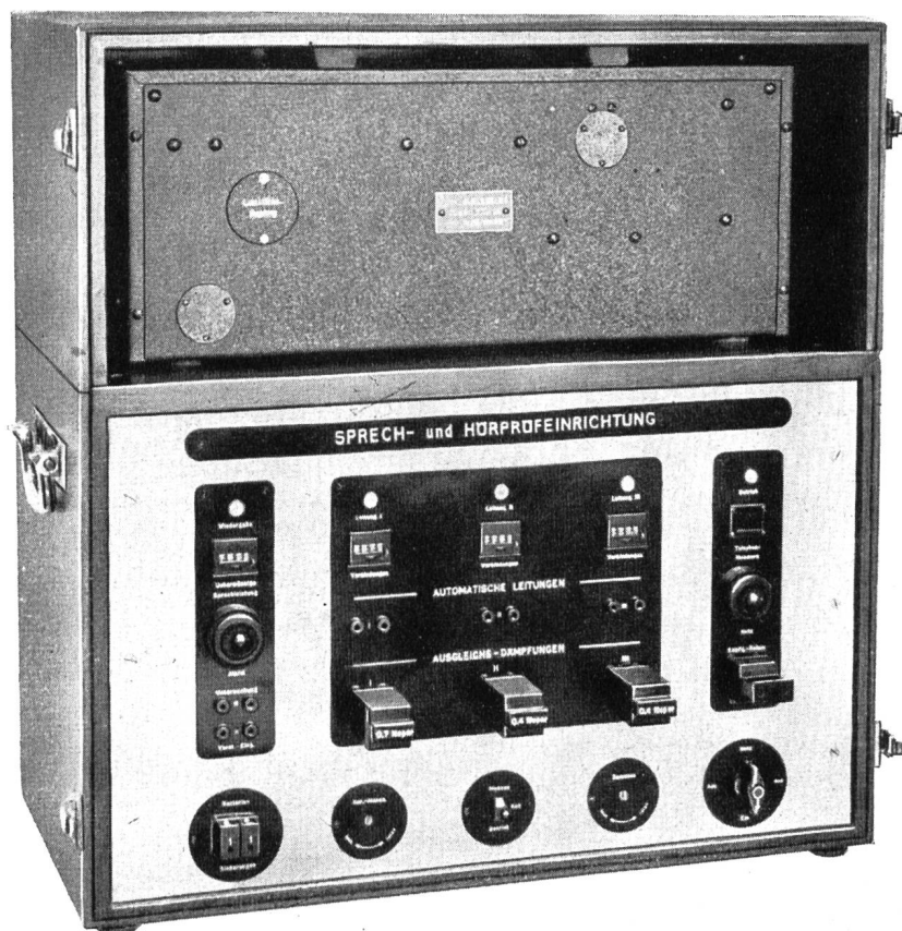
Fig. 1. Frontansicht — Vue extérieure.

La photographie (fig. 1) représente un de ces dispositifs, dont quelques-uns sont en service, à titre d'essai, dans des centraux de systèmes différents, Hasler, Bell et Siemens; nous en donnons ci-après la description.