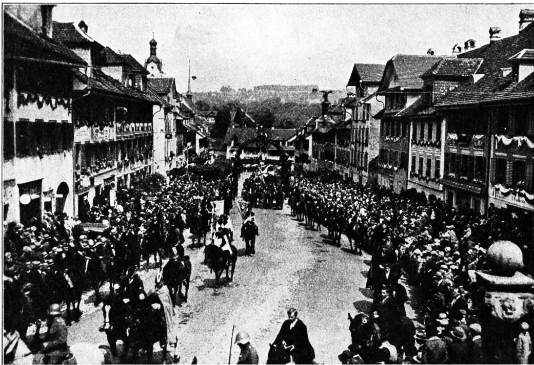
Abb. 5. Der Auffahrtsumritt.

Um 5 Uhr morgens setzt sich der Zug von der Pfarrkirche aus in Bewegung. Die Musik spielt, die Glocken läuten, langsam durchschreitet die Menge den Flecken. Bei der Parkanlage „Schlössli“, der sogenannten ersten Station, macht der Zug Halt. Vom Pferde herab richtet der Ehrenprediger — meist ein auswärtiger Geistlicher — eine feierliche Ansprache an die Volksmenge, die sich um ihn geschart hat. Der Ansprache folgen eine Vorlesung aus dem Evangelium, die Fürbitten für das Gedeihen der Feldfrüchte sowie der priesterliche Segen. Weitere Stationen befinden sich auf dem Blosen-berg, auf der Höhe des Muchriedes und bei der St. Wendelinskapelle in der Nähe von Witwil. Im Dorfe Rickenbach wird nach Abhaltung einer Predigt ein längerer Halt gemacht, damit die Menge ihre leiblichen Bedürfnisse befriedigen kann. Die am Wege liegenden Dörfer und Weiler sind meist bekränzt oder haben Triumphbogen errichtet. Dem Zweck der Prozession entsprechend wird vor allem darum ge-