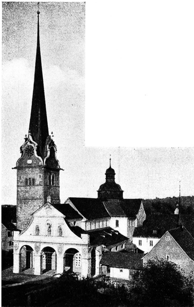
Abb. 1. Die Stiftskirche.

Nach dem Aussterben der Kyburger ging die Vogtgewalt an das Haus Habsburg-Oesterreich über. Es folgte nun eine Zeit der Ruhe und des Friedens, die den Aufschwung der Ortschaft erheblich begün-