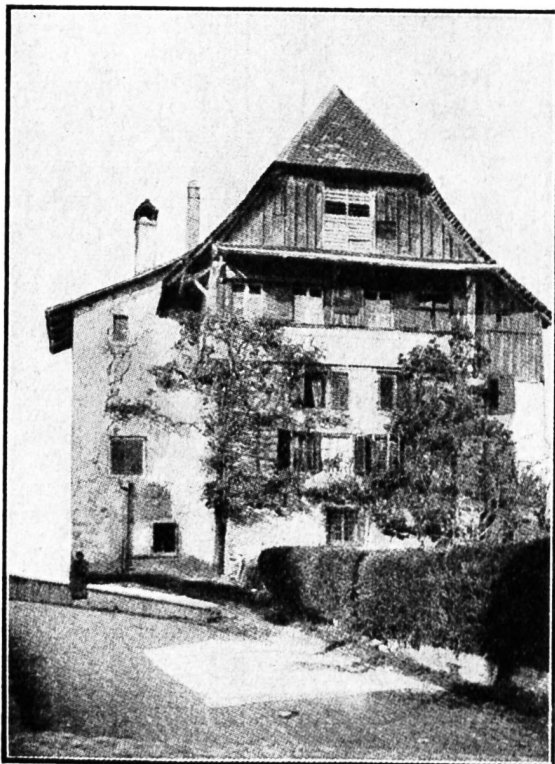
Abb. 4. Das „Schloss“.

Der Auffahrtsumritt. Weithin bekannt ist der Münsterer Auffahrtsumritt, eine Prozession, die im Jahre 1509 eingeführt wurde und die den Zweck hat, den Segen Gottes auf Feld und Flur herabzuflehen. Die Prozession bietet ein äusserst malerisches Bild und lockt immer zahlreiche Zuschauer herbei, namentlich auch solche aus protestantischen Landesteilen. Unter den Reitern bemerkt man die geistlichen Würdenträger, den Stiftsweibel in rotem Mantel, mehrere Gruppen Kavallerie, das Musikkorps und — in blauem Mantel — die Abgeordneten des Kirchenrates. Das Chorherrenstift ist seit dem Jahre 1663 mit einer offiziellen Abordnung vertreten. Den Berittenen folgen zahlreiche Wallfahrer zu Fuss.