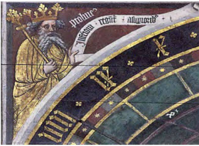
Ptolemaios als König mit Blattkrone und Szepter. Stralsund, Astronomische Uhr, 1594 (Ergänzungsband, S. 406).