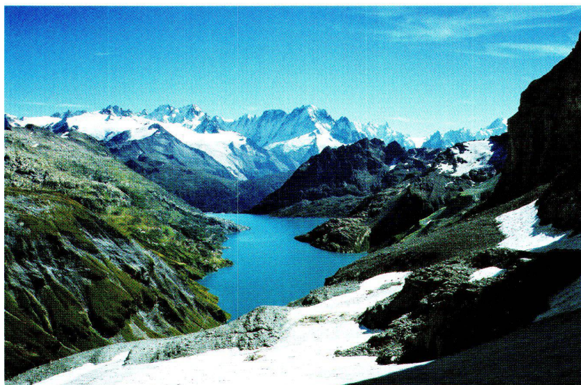
Abb. 7: Der Lac d'Emosson. Blick in südlicher Richtung mit dem Glacier du Tour und der Aiguille Verte im Hintergrund.