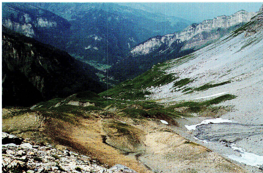
Abb. 6: Das Vallon de Tenneverge über dem Fer à Cheval.