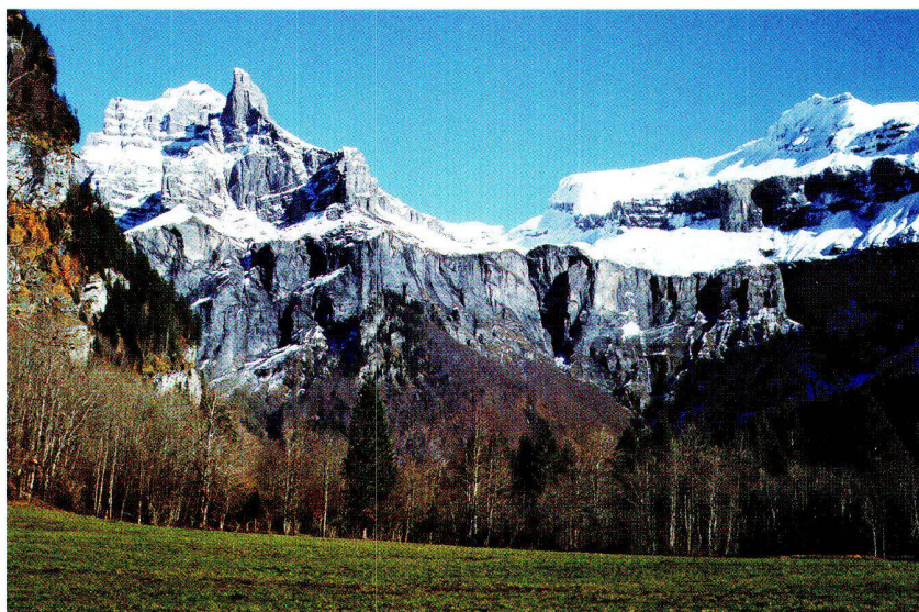
Abb. 5: Blick ins Tal von Fer à Cheval. Von links nach rechts: Pic de Tenneverge (2985 m), dessen Pass und Tal, dann die Pointe de la Finive (2838 m).

Jean Sesiano Dipl. Geologe Minéralogie, Université de Genève, 13 rue des Maraîchers, CH-1205 Genève E-Mail: jean.sesiano@terre.unige.ch