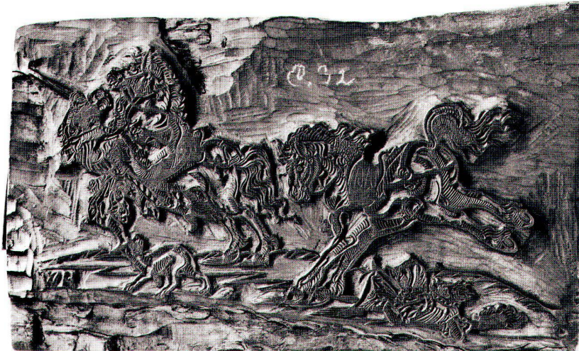
Abb. 4: Hans Weigel d. Ä.: Zwei durchgehende Pferde, um 1560 (?), Holzschnitt, 20x11,5 cm.