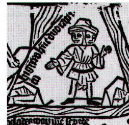
Abb. 1: Zweiköpfiger Mann mit erklärender Beischrift hi ge[n]t[el]s h[abe]nt duo capit . Ausschnitt aus dem Fragment einer Weltkarte (vgl. Abb. 2).

Der erhaltene Stock ist in erstaunlich gutem Zustand (Abb. 3). Nur an der oberen Kante finden sich grössere Ausbrüche, die das Druckbild beeinträchtigen. Die vielen kleinen, von Rissen im Holz herrührenden Unterbrechungen der gedruckten Linien sind hingegen nicht auf mechanische Einflüsse von aussen zurückzuführen. Diese Schwundrisse rühren von der Reaktion des Holzes auf wechselnde klimatische Bedingungen her. Nimmt man nur die Qualität des erhaltenen Stocks als Massstab, so wurde die Karte nicht bis zur völligen Abnutzung der Stöcke gedruckt. Allerdings lässt sich daraus nicht einfach ein mit der Zeit erfolgtes gesunkenes Interesse an der Abbildung ableiten, da ebenso andere Stöcke der Karte in stärkere Mitleidenschaft gezogen worden sein könnten.