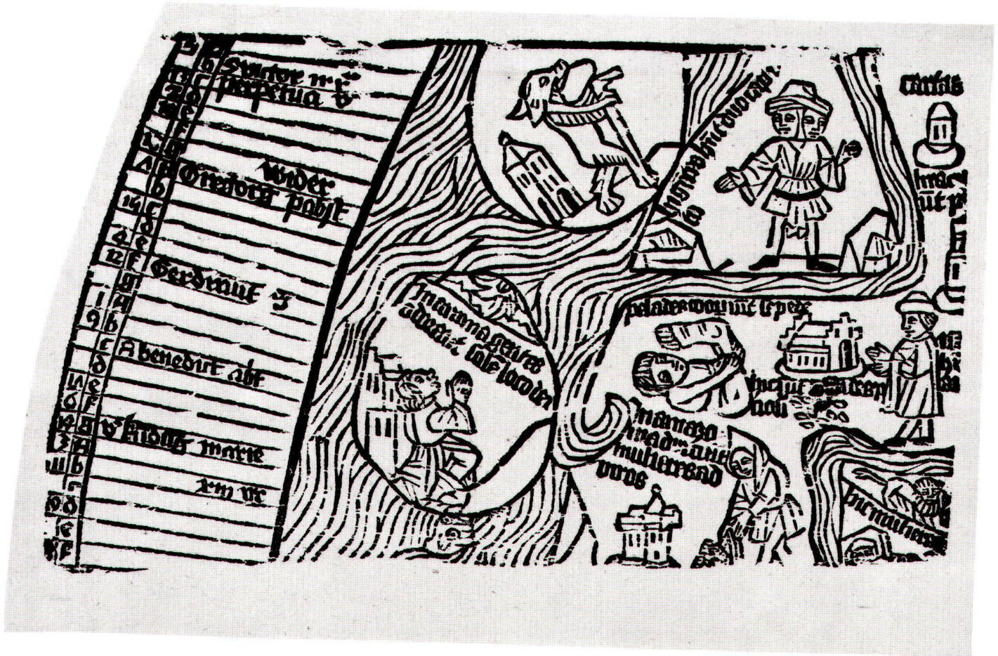
Abb. 2: Unbekannt: Fragment einer Weltkarte mit Kalender, um 1480 (?), Holzschnitt, 20x11,5 cm.

Als sicher kann gelten, dass der Stock nachträglich beschnitten wurde. Sowohl rechts als auch unten sind Schriften und Figuren auf eine Art und Weise unterbrochen, die das Ansetzen eines weiteren Stocks kompliziert gestalten würden. Zudem besitzt der Stock an der oberen Kante eine Begrenzungslinie. Ein solcher in das Holz geschnittener Rahmen ist typisch für Einblattdrucke. Hier ist er mitten in der Darstellung zwar ungewöhnlich, doch darf man davon ausgehen, dass auch die beiden anderen Seiten ursprünglich eine solche Rahmenlinie besessen haben.