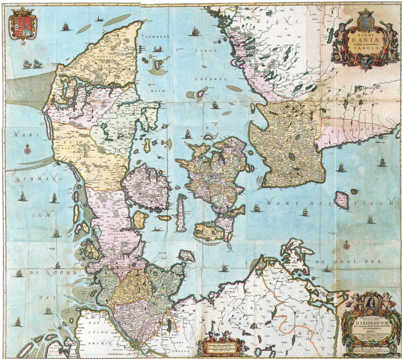
Abb. 2: Hugo Allard: Regni Daniae Novissima et Accuratissima Tabula . Die bisher in keiner anderen Sammlung nachgewiesene grosse Dänemarkkarte, die dem dänischen König Frederik III. (Regierung 1648–1670) gewidmet ist, entstand in Amsterdam (Eb 68, Nr. 13).

Kretas, der Inseln der Ägäis und der Peloponnes. Neben eigentlichen Landkarten finden sich im Sammelatlas Seekarten, Flusskarten, Städteansichten und -pläne, Gebäudeansichten, Schlachten- und Festungspläne und eine Flaggentafel. Die Karten, die durch ihre einheitliche Kolorierung auffallen, sind von unterschiedlicher Grösse. Neben drei Wandkarten, die aus sechs Einzelblättern zusammengesetzt sind, finden sich auch Karten, die wesentlich kleiner als das Blattformat sind; diese sind zum Teil aus Büchern entnommen und auf die Atlasseiten aufgeklebt worden.