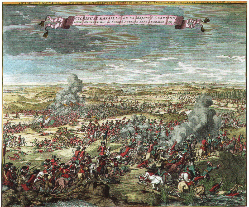
Abb. 3: Darstellung der Schlacht von Poltawa, in der Zar Peter der Grosse im Jahre 1709 den schwedischen König Karl XII. entscheidend besiegte und die russische Grossmachtstellung begründete. Kupferstich, wahrscheinlich aus Holland (Eb 68, Nr. 133).