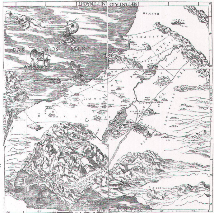
Abb. 2. Die durch Vergleich der Froschauer-Karte mit dem Cranach-Fragment berechnete Verzerrung der ersteren (Abb. 1) auf 147% in der y-Achse und die dabei durch digitale Umformung erreichte Simulation. Die Vorwegnahme des wirklichen Erscheinungsbildes der echten Cranach-Karte (Abb. 3) ist augenfällig.