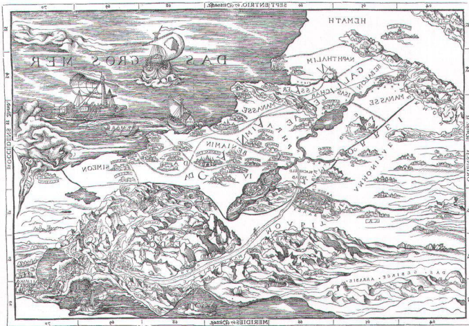
Abb. 4. Die aus der rekonstruierten Cranach-Karte (Abb. 3) durch digitale Umformung in der y-Achse auf 69% simulierte Entstehung des Kartenbildes der Zürcher Froschauer-Bibel von 1525. Der Vergleich mit der wirklichen Froschauer-Karte des Heiligen Landes (Abb. 1) ist überzeugend.