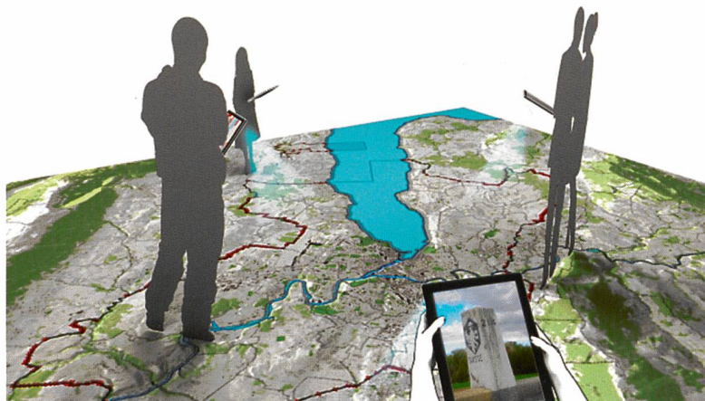
Figure 2: Réalité augmentée – Dépasser les bornes

Préparez vos dossiers afin de soumettre votre projet sur notre site www.geofab-grandgeneve.org . Vous y trouverez toutes les informations nécessaires. Nous nous réjouissons de découvrir vos projets innovants.