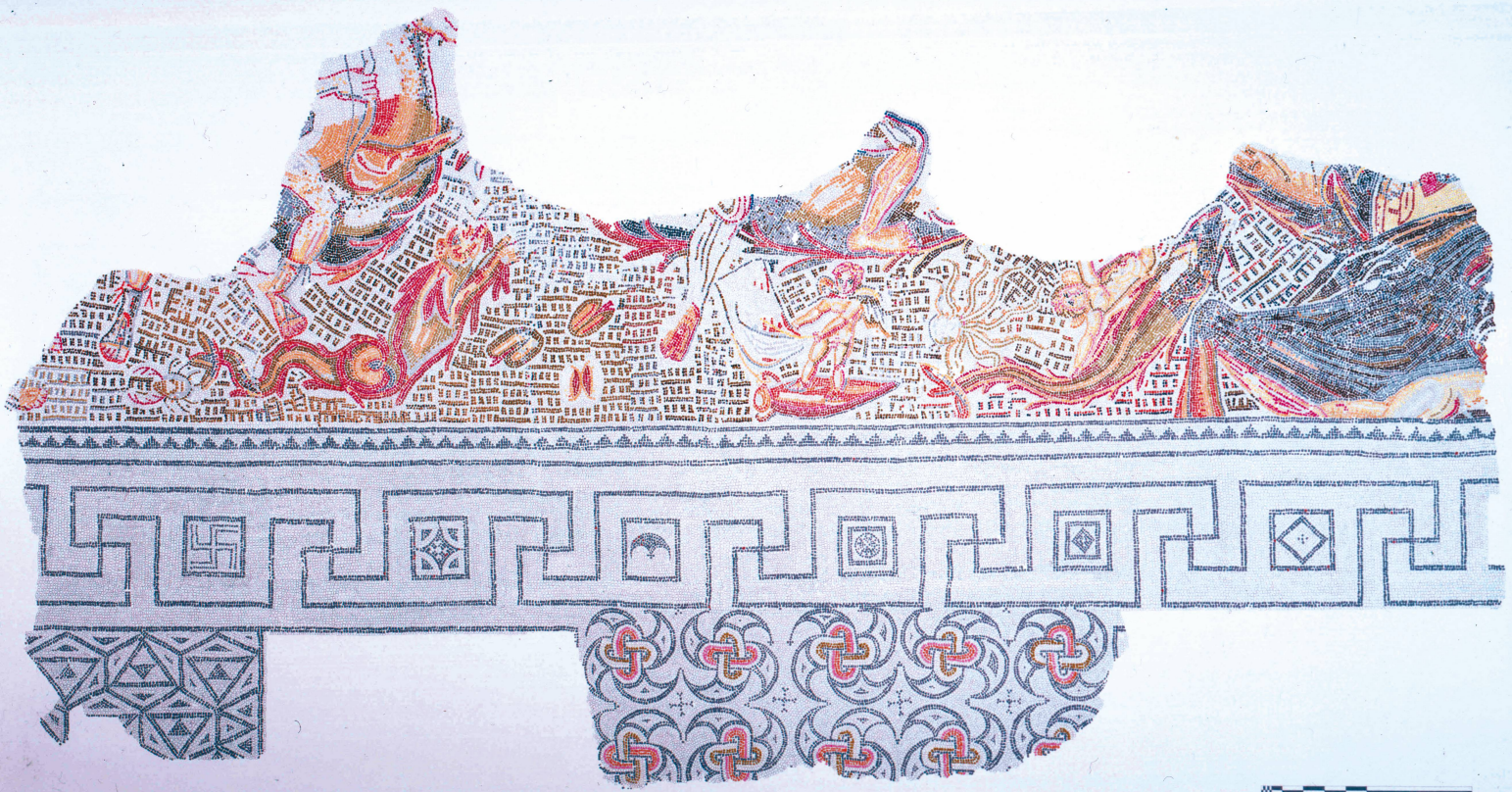
Tesselle à tesselle de la mosaïque de Neptune. Dessin: S. Rebetez.