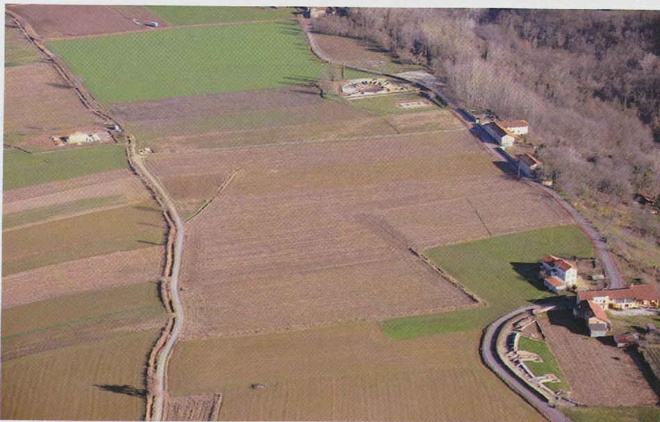
Fig. 1 — Panoramica della Piana della Roncaglia con i resti della città romana di Augusta Bagiennorum.