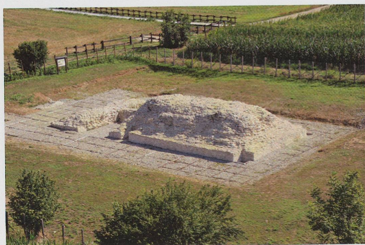
Fig. 5 — Panoramica dell'area archeologica con il podio del tempio a conclusione degli interventi.

rimangono ancora da esplorare (fig. 4). Il risultato delle indagini, condotte tra il 2001 e il 2003, ha confermato la costruzione dell'edificio su un terrapieno artificiale. La cavea, di forma ellittica (m 105,60 x 77), è risultata delimitata da un muro perimetrale cui si addossavano all'esterno una serie di contrafforti posti a distanza regolare che sostenevano un prospetto ad archi. Avancorpi ad U erano destinati agli scalini in laterizi, ancora conservati, per accedere alle gradinate dell'ordine superiore, presumibilmente in legno, mentre un corridoio in parte voltato, conduceva a quelle inferiori. I pochi materiali rinvenuti nello scavo, soprattutto monete in bronzo (assi di Antonino Pio, Faustina II e un sesterzio di Adriano), indicano l'utilizzo del monumento, costruito dopo la metà del I d.C., per tutto il II secolo.