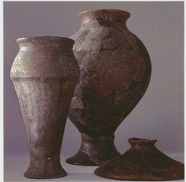
Fig. 189 — Conthey. Céramiques en pâte indigène des tombes de St-Séverin (à gauche) et des Râpes d'Aven (grand vase balustre et couvercle).

1083. Pot ou gobelet indigène à panse tronconique. Pâte brun-beige, surface gris-noir. Encolure resserrée, rebord déversé à lèvre arrondie. Panse marquée par une carène. Pied annulaire haut débordant. Décor incisé sur la partie haute de la panse, sous l'encolure: deux registres d'incisions fines, en zig-zag, cantonnés par des lignes d'incisions fines. Sur la partie inférieure de la panse, bandes au brunissoir ( stralucido ) convergent vers le fond. H. 25 cm; Diam. ouv. 11 cm.