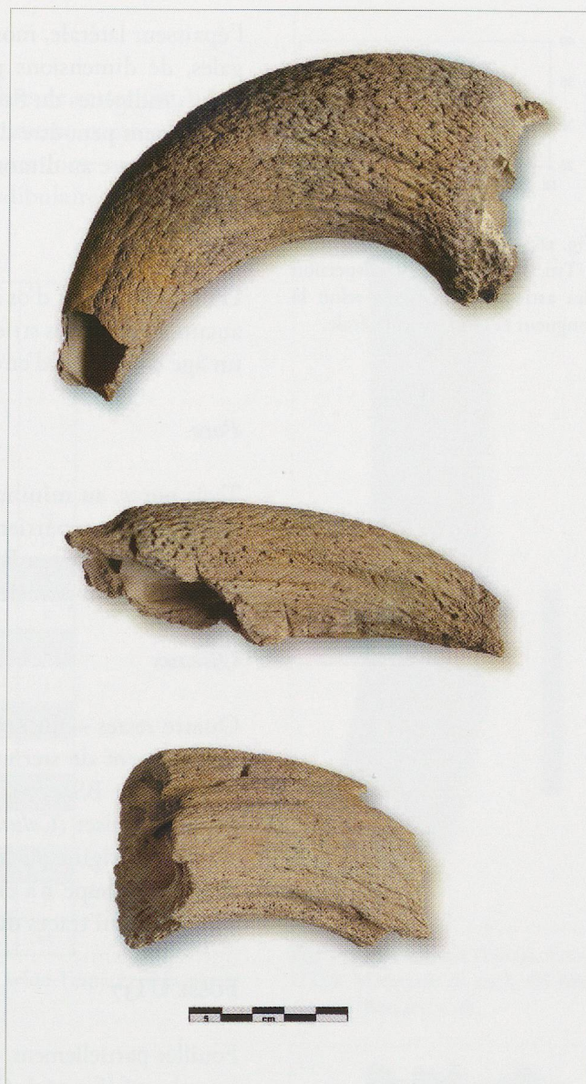
Fig. 260 — Bramois (BS04). Chevilles osseuses de bœuf ( Bos taurus ). De haut en bas, taureau (UT30, BS04/76), taureau (UT40, BS04/121-1), bœuf (?) (UT39, BS04/127-14).