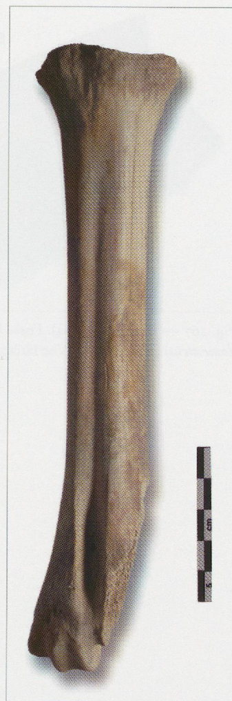
Fig. 265 — Bramois (BSO4). Fosse UT39. Métatarse de vache (?) ( Bos taurus ) (BSO4/127-15).

Deux grands fragments de crâne – env. une moitié longitudinale et un maxillaire complet – sont issus de la fosse UT39 (BSO4/127-9, 127-10). Une strie de découpe, parallèle à la suture de l'os frontal, témoigne de la volonté d'ouvrir la boîte crânienne afin de prélever la cervelle (BSO4/127-9) (fig. 266). La morphologie du cornillon a permis une attribution spécifique à la chèvre. D'après l'âge dentaire, nous sommes