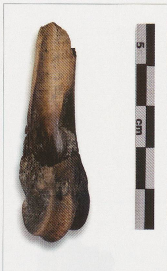
Fig. 258 — Bramois (BS04). Fosse UT12. Partie distale d'un métatarsaire de caprinés ( Ovis aries / Capra hircus ) (BS04/2) avec traces de brûlure.

les trois traces de découpe – très courtes, assez profondes et perpendiculaires à la diaphyse, relevées dans la région du genou 391 – résultent du tranchage des tendons des muscles quadriceps qui contiennent la patella . L'absence des os grands sésamoïdes peut s'expliquer par la section du ligament suspenseur du boulet qui les contient, opération qui peut être réalisée sans laisser de traces sur le métatarsaire principal. De même, les tendons extenseurs et fléchisseurs ont pu être sectionnés avant le dépôt de cet arrière-train, étant donné qu'aucune phalange n'a été recueillie dans la fosse. L'hypothèse selon laquelle nous nous trouverions face à un dépôt secondaire et que des petits os auraient été oubliés dans le dépôt primaire, se voit infirmée par la grande fraîcheur des surfaces articulaires des tarsiens et des métatarsaires et le fait que la rupture des ligaments rattachant les métapodes aux phalanges intervient en dernier. La patte devait donc très certainement toujours être en connexion lors de son dépôt.