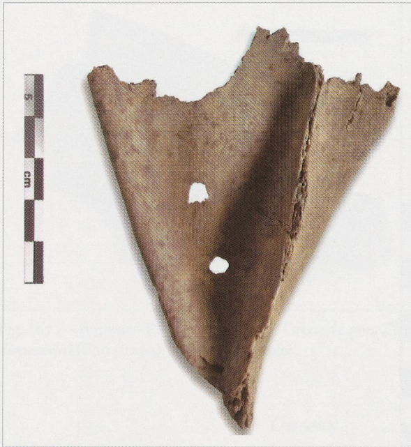
Fig. 269 — Bramois (BS04). Fosse UT40. Omoplate ( scapula ) de capriné ( Ovis aries/Capra hircus ) (BS04/115-5) avec perforations.

astragales. Le fragment de la région orbitale (arc zygomatique) provient, par contre, d'un individu de grande taille (BS04/118-2).