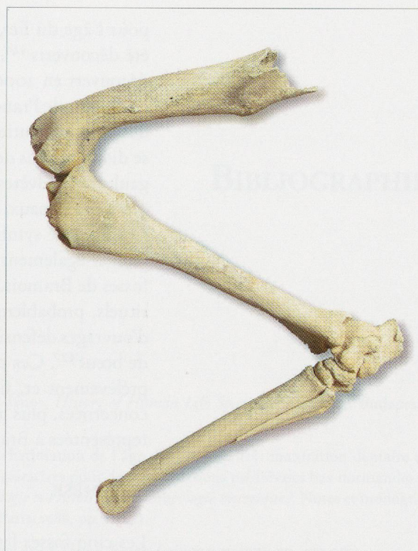
Fig. 274 — Bramois (BSO4). Fosse UT12. Patte postérieure de cheval ( Equus caballus ) (BSO4/26).

Leur contenu pourrait alors témoigner d'une autre pratique culturelle ayant également exigé la mise à mort d'animaux domestiques, la consommation partielle de certains d'entre eux, puis le rejet des reliefs dans une fosse prévue à cet effet. Or, le sacrifice d'animaux, à finalité alimentaire ou non, est connu et bien documenté