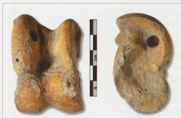
Fig. 273 — Bramois (BS04). Fosse UT30. Astragale perforé de bœuf ( Bos taurus ) (BS04/66). Vues latérale et dorsale.

A l'âge du Fer, contrairement au bœuf, aux caprinés et au porc qui sont consommés, le cheval jouit d'un statut particulier. Ce dernier se traduit par la rareté des restes équinés, provenant en outre majoritairement de bêtes réformées, dans les dépotoirs d'habitat protohistorique 412 . L'hippophagie serait, de plus, uniquement pratiquée par la classe populaire puisque les habitats dits princiers, comme Posieux, Châtillon-sur-Glâne (FR), se distinguent par une quasi-absence des restes équinés, dont la consommation n'est en outre pas certifiée 413 . Le cheval s'avère, par contre, très présent dans les lieux de culte. Les sanctuaires gaulois – Gournay, Ribemont et Vertault par exemple – ont livré des centaines d'individus sacrifiés 414 . En Suisse, il est très bien représenté dans les sites de La Tène et de Cornaux, Les Sauges (NE) dont la fonction rituelle ne fait plus aucun doute pour une très large majorité de chercheurs. A Cornaux, comme à Bramois, des pattes en connexion ont été mises