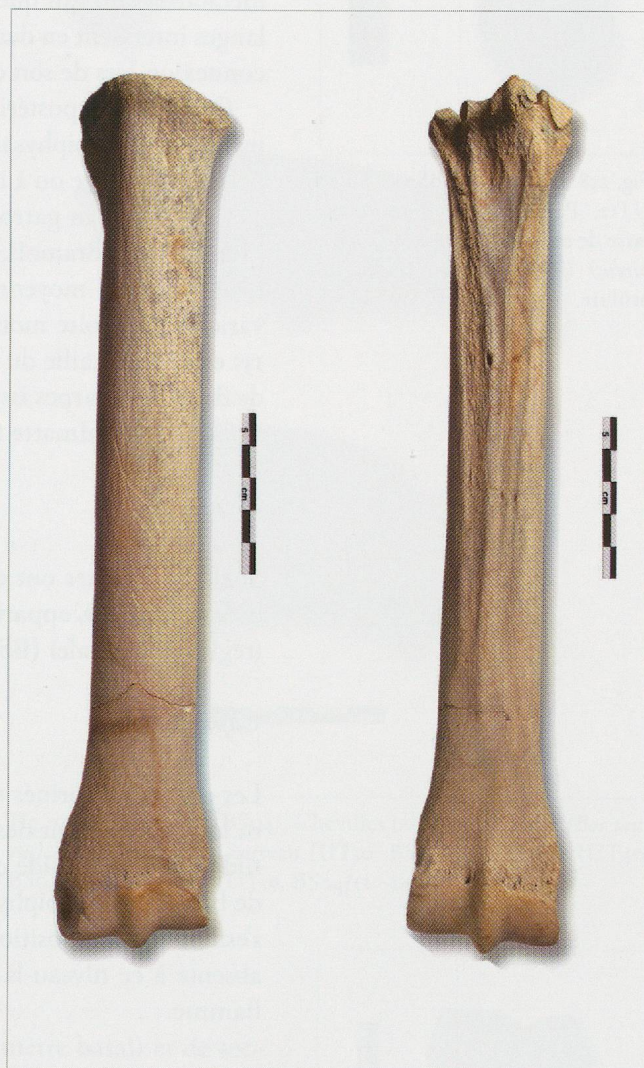
Fig. 257 — Bramois (BS04). Fosse UT12. Métatarse III de cheval ( Equus caballus ) (BS04/26). Vues dorsale et plantaire.