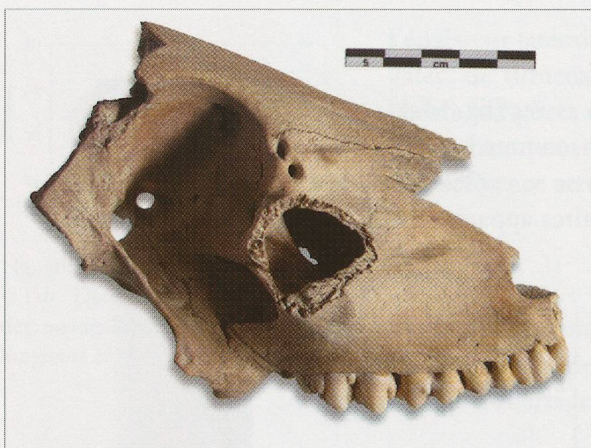
Fig. 267 — Bramois (BSO4). Fosse UT39. Crâne de porc ( Sus domesticus ) (BSO4/127-1). Vue latérale droite.

en présence de trois individus. Ces derniers ont été abattus à un peu moins d'1 an, autour d'1 an et vers 1 an et demi.