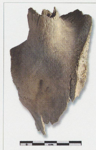
Fig. 266 — Bramois (BSO4). Fosse UT39. Crâne de chèvre ( Capra hircus ) (BSO4/127-9) fracturé. Vue frontale.