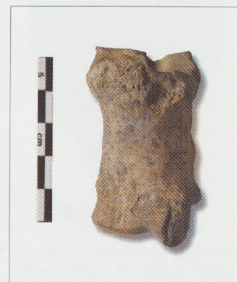
Fig. 261 — Bramois (BS04). Fosse UT30. Phalange proximale de bœuf ( Bos taurus ) (BS04/76) pathologique (tissu néoformé).

Les astragales de Bramois entrent parfaitement dans les marges de variations de ceux des bœufs laténiens. Le diagramme de dispersion, selon la longueur et