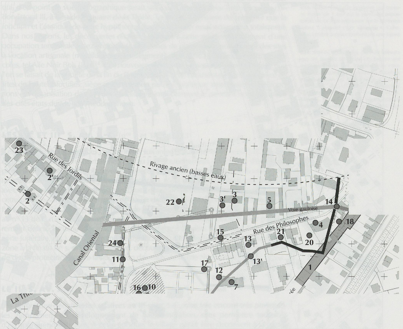
FIG. 111. Plan des interventions dans la zone de Verdon-les-Bains. Les chiffres indiquent les points de fouilles (les chiffres en gras indiquent les points de fouilles effectués).

L'ÂGE DU BRONZE (M. 22, 27 et 28, 33). La mise au jour du site de Verdon-les-Bains en 1957 a permis de constater l'existence d'une occupation humaine dès le début de l'âge du Bronze. Cette occupation est caractérisée par la présence de structures en pierre et de céramiques. Les fouilles ont permis de constater que la zone de Verdon-les-Bains a été occupée dès le début de l'âge du Bronze.