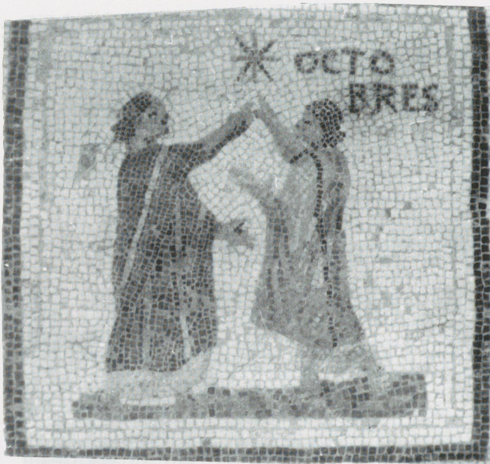
Fig. 2 - Le mois d'octobre.