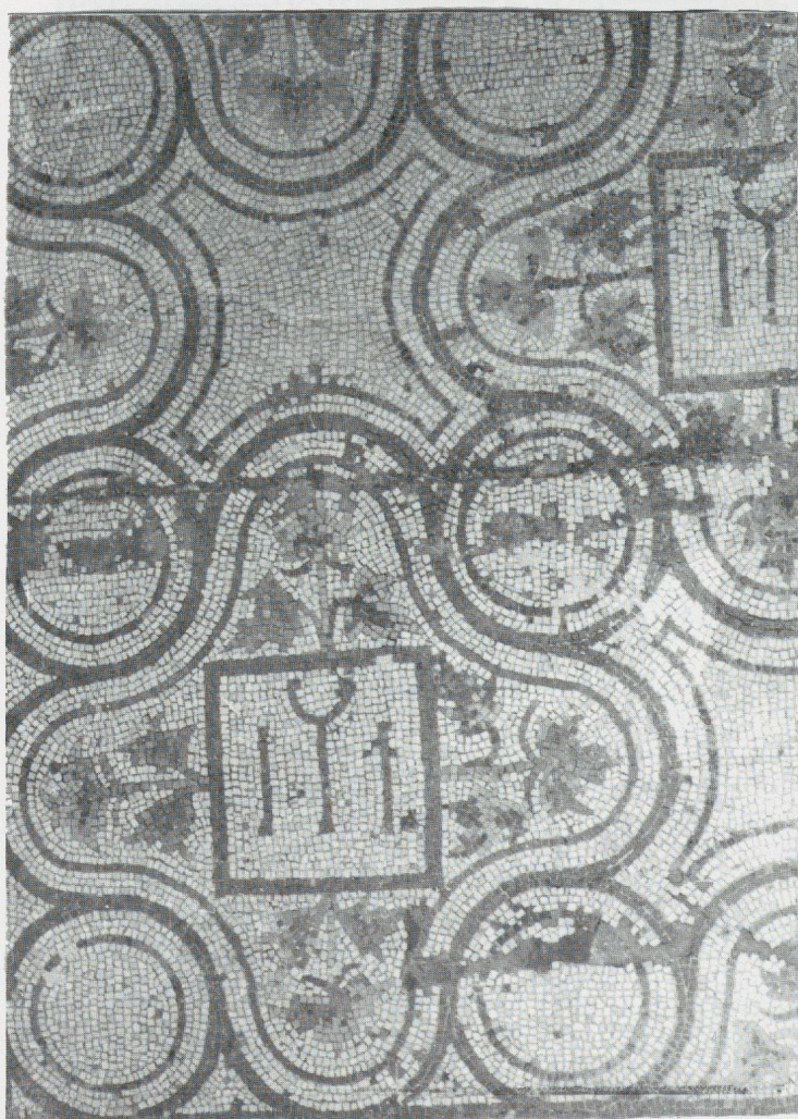
Fig. 3 - Coussins et emblèmes des Telegenii . Mosaïque de la même maison.