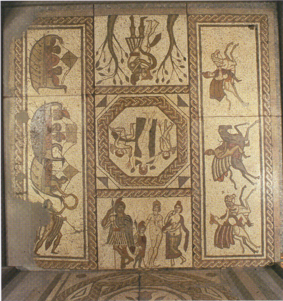
3 - Low Ham (Somerset). Cycle narratif de Didon et Enée. Taunton, Somerset County Museum (cliché du Musée).