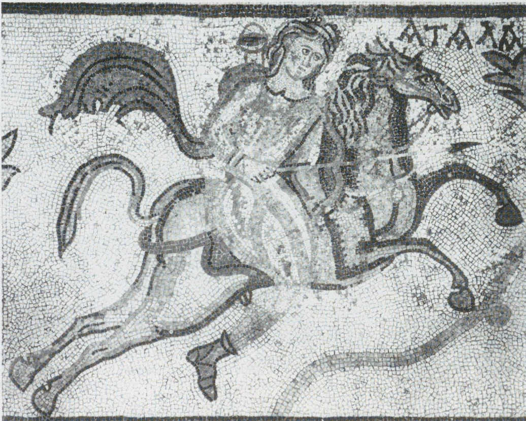
20 - Halicarnasse. "Villa tardive", Atalante. British Museum (d'après HINKS, 1933).