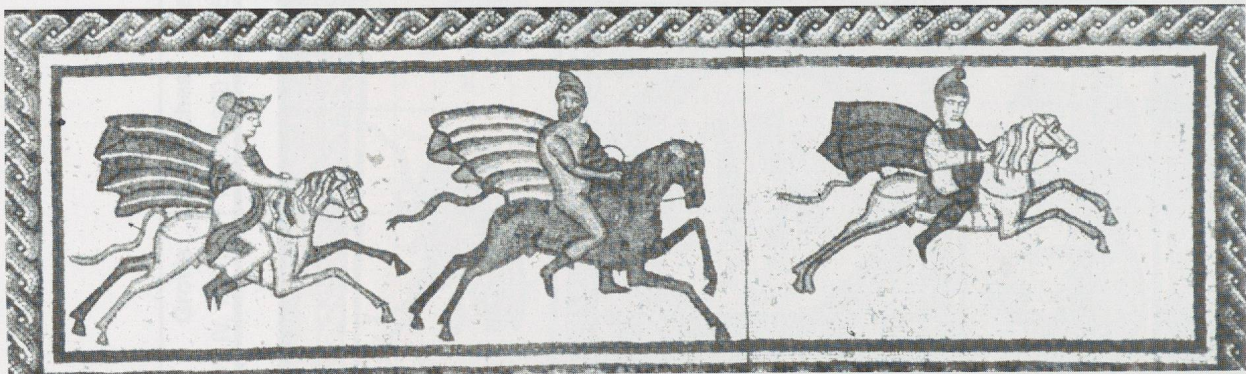
5 - Low Ham (Somerset). Détail : panneau de la chasse. Taunton, Somerset County Museum (d'après BIANCHI BANDINELLI, 1970).