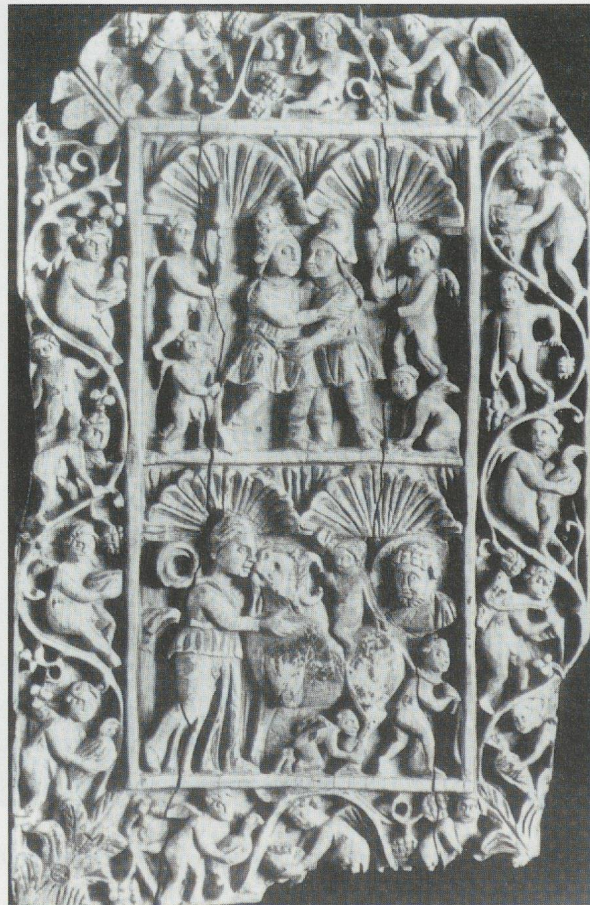
14 - Trieste. Plaque d'ivoire : Didon et Enée (?). Musée communal de Trieste (d'après VOLBACH, 1976).