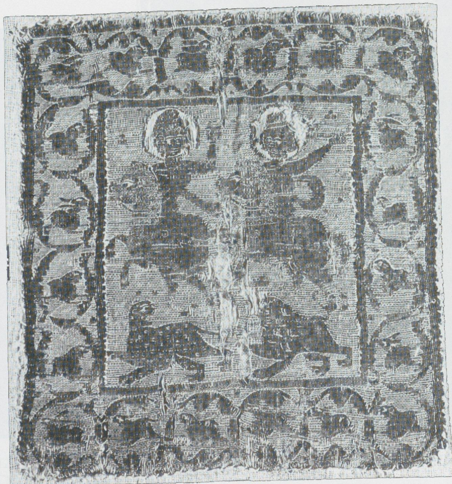
8 - Egypte (?). Tissu. Vienne, Öst. Museum für ang. Kunst (d'après NOLL, 1982).