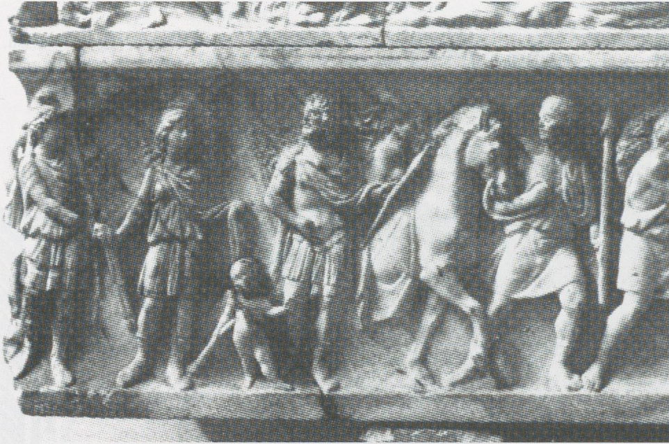
9 - Rome. Sarcophage découvert Via Cassia. Musée National Romain (d'après KOCH, SICHTERMANN, 1982).