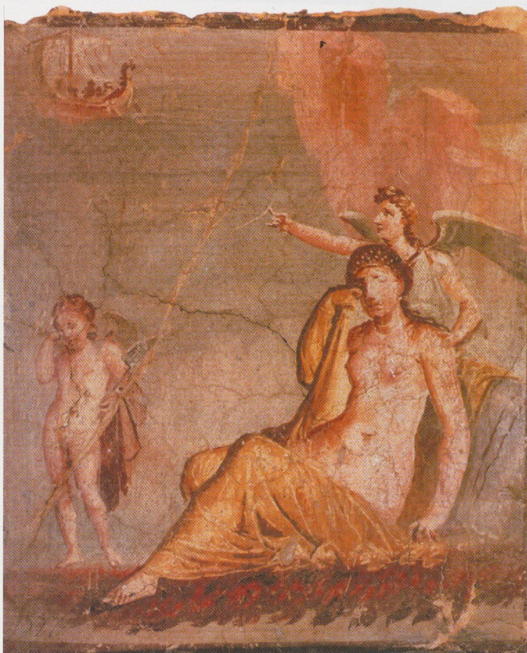
18 - Pompéi. Maison de Méléagre, VI, 9, 2. Ariane abandonnée. Musée archéologique de Naples.