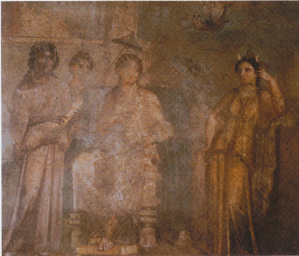
15 - Pompéi. Maison de Méliagre, VI, 9, 2. Abandon de Didon. Musée archéolo- gique de Naples (d'après DE CARO, 1994).