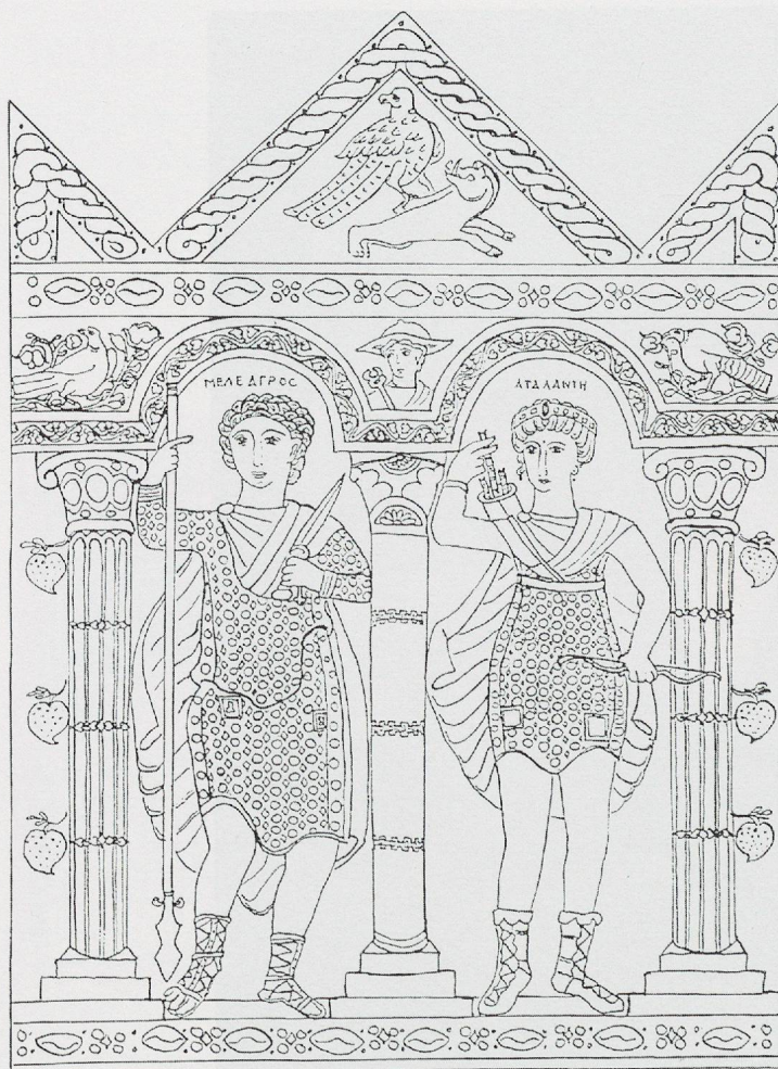
21 - Provenance inconnue. Tissu de la Fondation Abegg : Atalante et Méléagre, dessin (d'après SIMON, 1970).