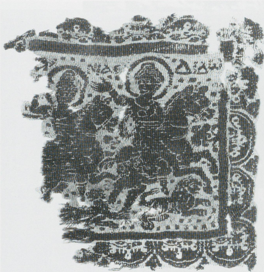
7 - Achmim (Egypte). Tissu. Düsseldorf, Kunstmuseum (Inv. 13026).