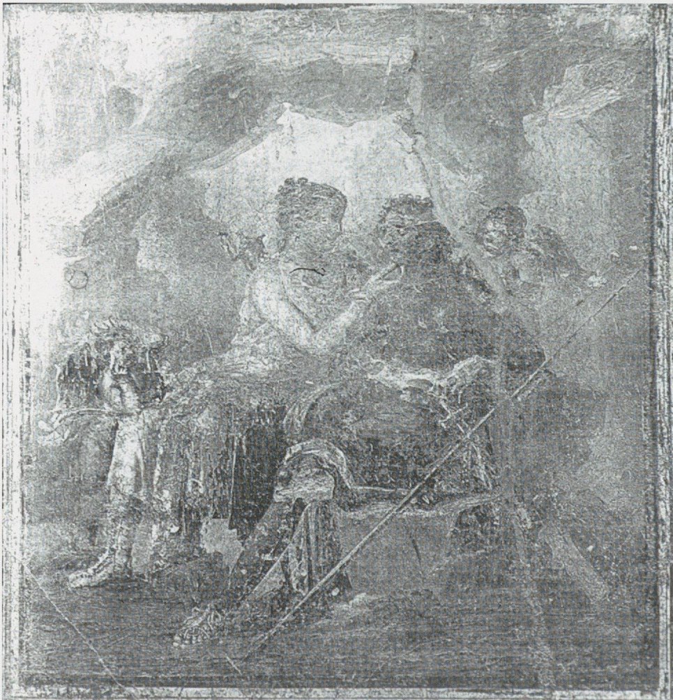
10 - Pompéi, VI, 15, 6. Didon et Enée dans la grotte (d'après SOGLIANO, 1897).