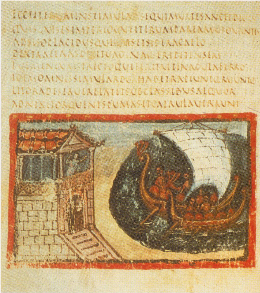
17 - Rome, Vat. lat. 3225. Abandon de Didon (fol. 39 v) (d'après WRIGHT, 1993).