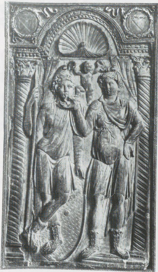
13 - Brescia. Volet de diptyque : couple d'amoureux identifiés comme Didon et Enée. Musée chrétien de Brescia (d'après VOLBACH, 1976).