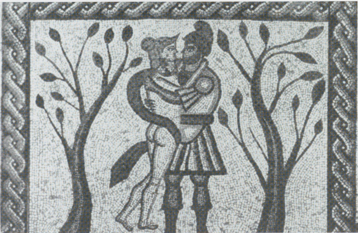
12 - Low Ham (Somerset). Détail : Didon et Enée enlacés. Taunton, Somerset County Museum (d'après BIANCHI BANDINELLI, 1970).