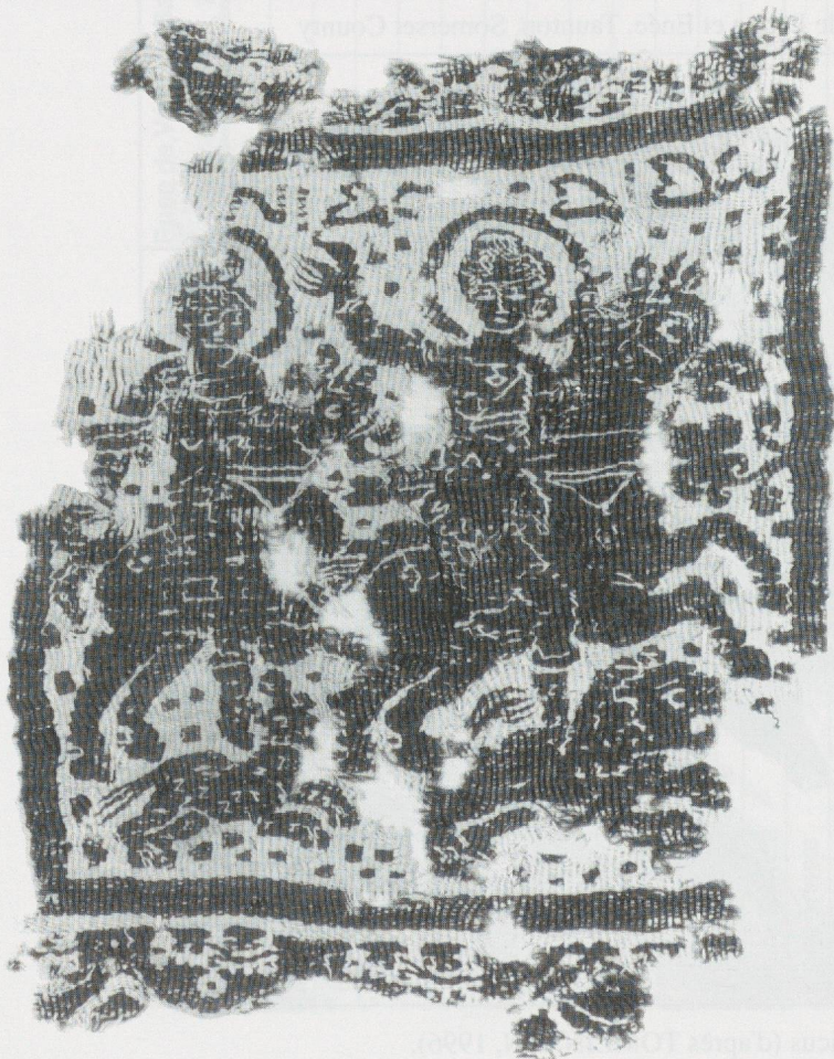
6 - Achmim (Egypte). Tissu. Düsseldorf, Kunstmuseum (Inv. 13025).