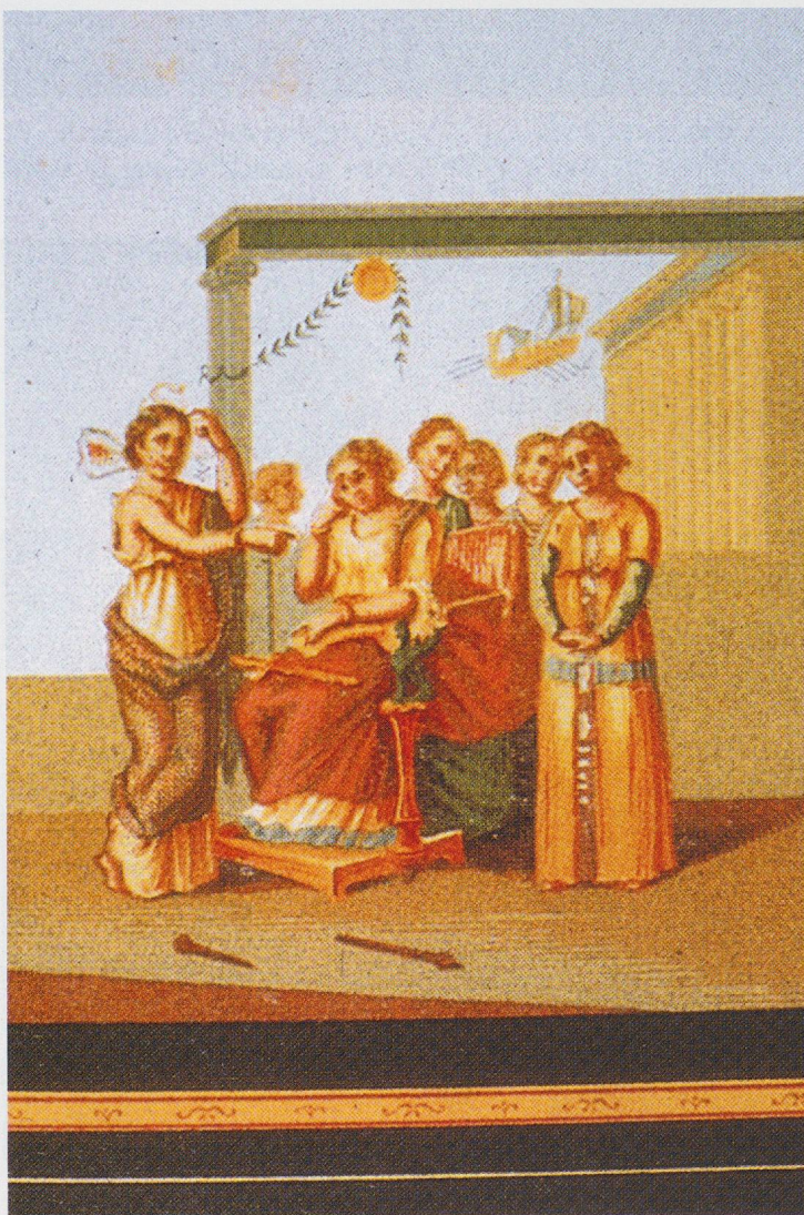
16 - Pompéi. Maison de l'académie de musique, VI, 3, 7. L'abandon de Didon (relevé aquarellé de Niccolini, d'après PPMIV , p. 287, fig. 18).