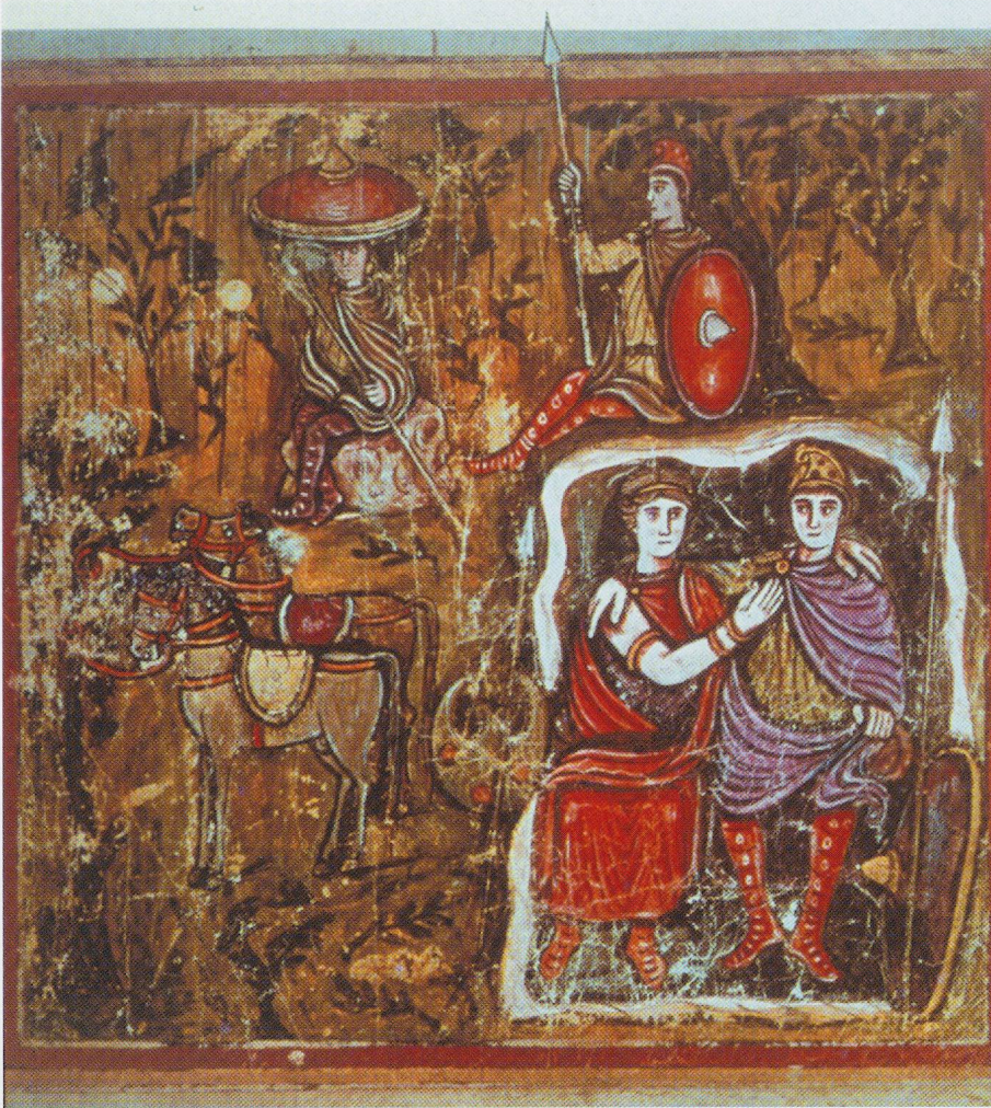
11 - Rome, Vat. lat. 3867. Didon et Enée dans la grotte (fol. 106 r) (d'après WEITZMANN, 1979).