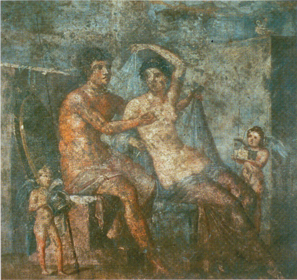
19 - Pompéi. Maison de Méléagre, VI, 9, 2. Tablinum 8, mur sud : Mars et Vénus. Musée archéologique de Naples (d'après PPM IV, p. 682, fig. 51).