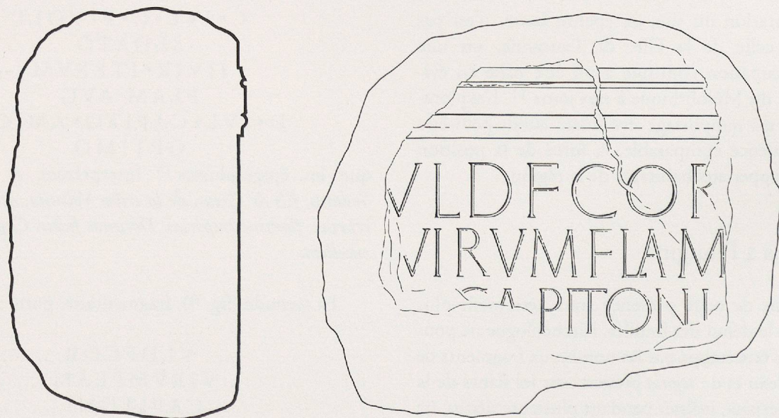
Fig. 9. Coupe et vue du fragment d'épithaphe découvert en remploi dans les fondations du château (éch. 1:10).