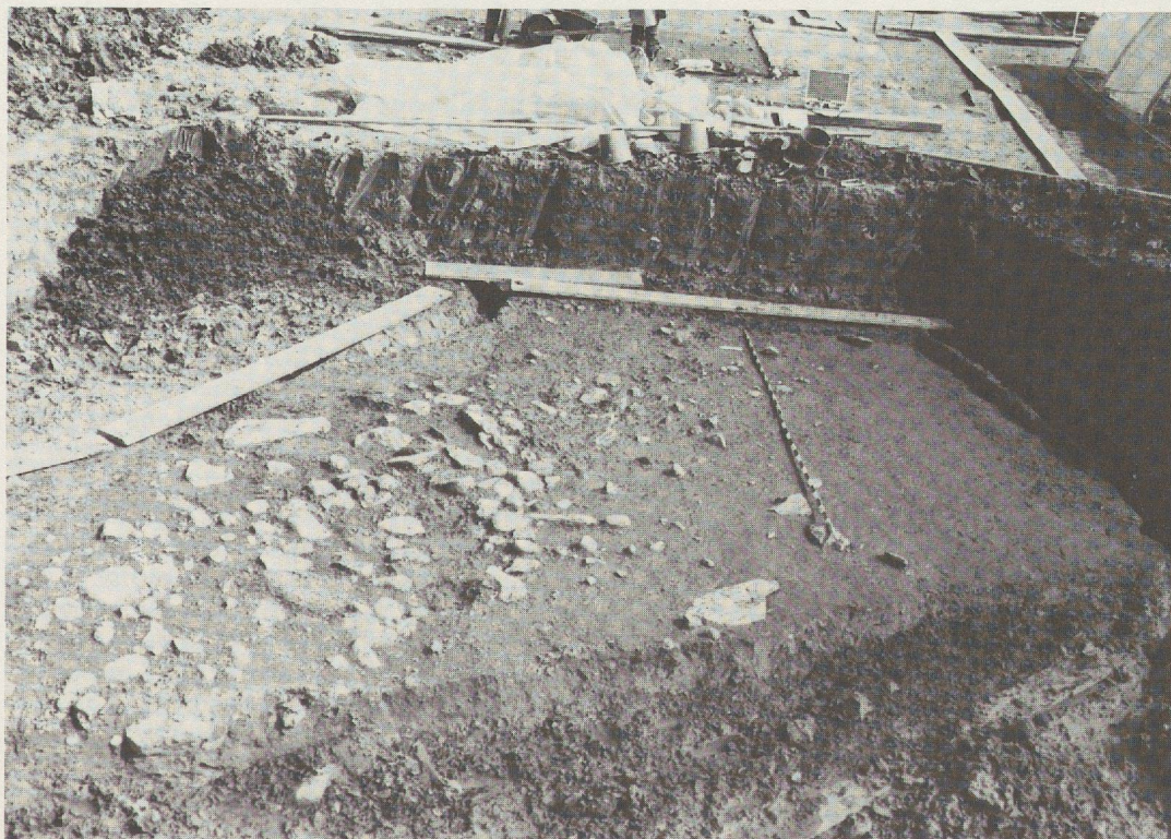
Figure 83 Vue depuis l'ouest du sondage S34 à la fin des travaux (couche 11).

Un seul vestige archéologique a été recueilli dans le secteur 34 (fig. 55, N° 862), lors d'un sondage en 12a afin de récolter des charbons de bois pour datation. Aucun témoin architectural n'est visible en stratigraphie, d'importants colluvionnements latéraux étant peut-être à l'origine de cette absence locale.